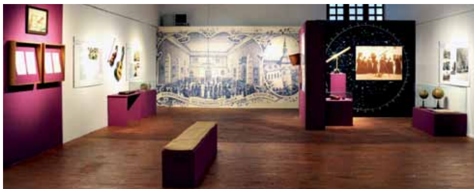
Pogled na razstavo Znanje je luč v nekdanji rekreacijski dvorani, danes Galeriji na Loškem gradu.

K pripravi razstave in spremnega kataloga smo pristopili interdisciplinarno; znanje in védenje smo združili kustos arheolog, kustosinja zgodovinarica in kustosinja etnologinja. V veliko pomoč nam je bilo sodelovanje z uršulinskim samosta-