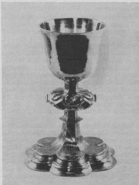
Gotski kelih iz cerkve Sv. Marjete v Kosezah iz leta 1528.

Cerkveno kolekturo je takrat pomagal pobirati koseški cerkovnik Jakob Zakotnik. 45 Koseška cerkve je imela po pregledu iz 1759 4 1/2 njave, eno kajžo z vrtom in travnikom in en travnik »pod vtikam.« Kajžo je imel cerkovnik. 46