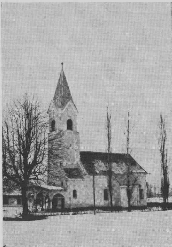
Cerkev Sv. Marjete v Kosezah danes.

hak, visok ok. 15 cm. V stožalu spodaj na notranji strani ima letnico 1528 in zlatarjev ali darovalčev znak v obliki mesarske sekire in črk PF. Ob vozlu debela so črke IHESUS, nad vozlom ob robovih isto, pod vozlom ob robovih pa črke MARIAH. 40 — Po šentviški matrikuli iz 1749 je imela cerkev tedaj še tudi star misale iz leta 1519, ki pa je danes neznan kje. Verjetno je bil to še stari oglejski, ki je bil kasneje zamenjan za rimskega. 41