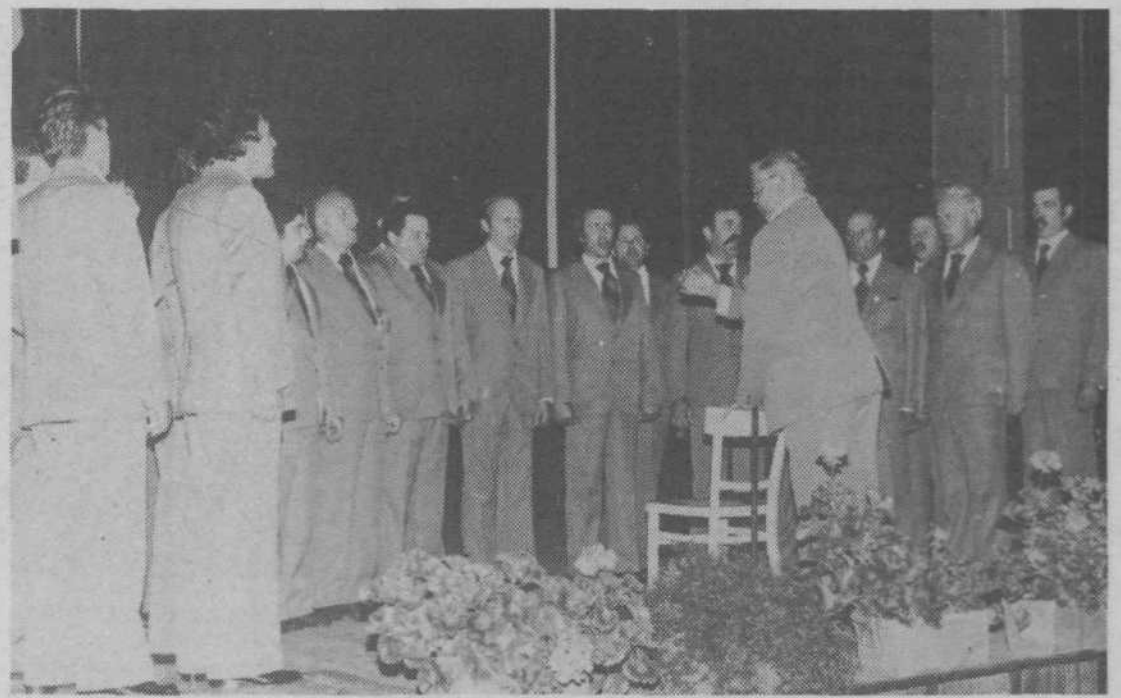
Moški pevski zbor iz Bizovika deluje šele drugo leto, vendar ima za seboj že številne uspešne nastope