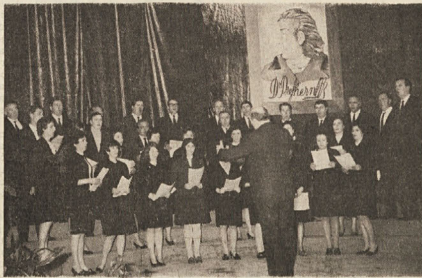
Prešernova proslava v Prosvetnem domu na Opčinah. Nastop pevskega zbora «Primorec» iz Trebč