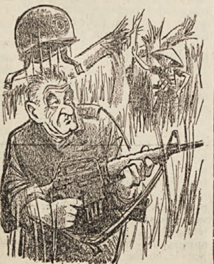
Pridi, pogovorila se bova...

Ne glede na to, kako se je zaključila zadeva z ostavko odv. Sfiligoj, pa še enkrat poudarjamo, da razne ustanove na Goriškem niso izpolnile pričakovanj Slovencev in da je ta ugotovitev tudi v vrstah SDZ spravila odbor iz ravnotežja. Ko je bil odbor ustanovljen, so nekateri upali, da je prišel ugoden čas za reševanje vprašanj slovenske narodne manjšine. Sedaj pa se je izkazalo, da je tudi goriški levi center nezmožen reševati te probleme. Najosnovnejša pravica, to je raba slovenskega jezika v uradnem poslovanju je še vedno «tabu», da ne govorimo tudi o drugih problemih. Še pred tremi leti je odvetnik Sfiligoj menil, da je za slovensko manjšino «najbolj koristno, če se znotraj odbora bje bitka za slovenske pravice», danes pa ni tega mnenja. Dejstvo je namreč, da se od leta 1965 do danes v odnosu do Slovencev ni doseglo nobenega uspeha, zaradi dvoumne politike KD in njenih zaveznikov. Nedvomno je, da ponovna vključitev SDZ v odbor levega centra; nikakor ni najboljši način za reševanje nešteti odprtih vprašanj slovenske narodnostne skupnosti. Nedosledno je očitati odgovornim predstavnikom, da niso držali obljub pri proučevanju naših potreb in da se še ni začelo iskati poti za globalno ureditev vprašanj, ki zadevajo slovensko narodno manjšino, obenem pa zvesto služiti KD in levemu centru.