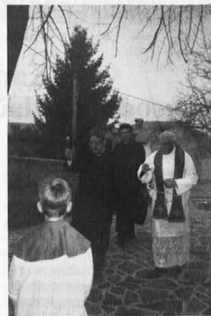
Nadškof Bommarco ob pastoralnem obisku na Peči

Sklep vizitacije je bil v nedeljo, 14. marca, po deseti maši in obisku na rupenskem pokopališču. K skupnemu kosilu z nadškofom so prišli člani pevskega zbora, obeh župnijskih