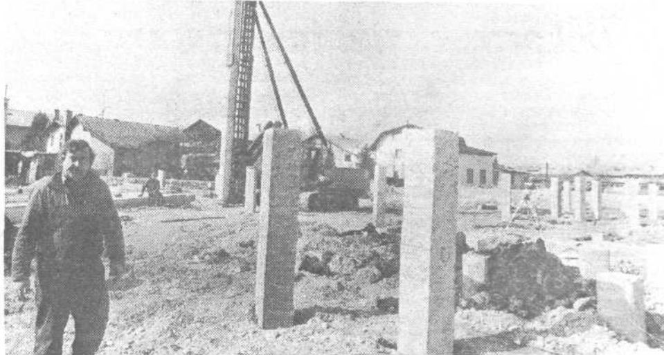
Posnetek prikazuje pilotiranje temeljev za novo osnovno šolo Livada, katere gradnja se bo pričela še v tem mesecu.