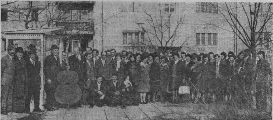
Izvajalci kulturno-umetniškega programa iz Adlešičev

KAKŠEN NAJ BO STATUS ZAVODA ZA POČITNIŠKA LETOVANJA V LJUBLJANI — CENTER?