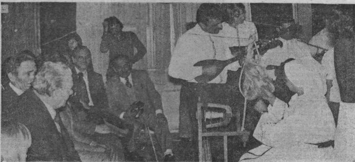
Le predi dekle, predi ...