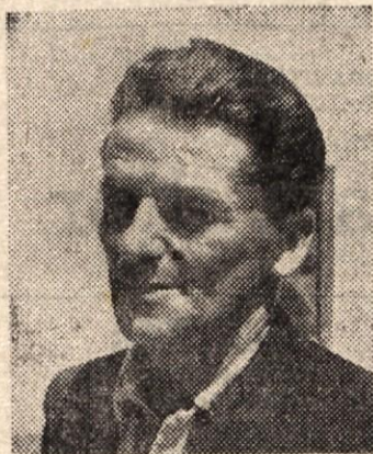
rok. Jaz sem bil med tem spet na progah. »Prereži vrvico!« so mi sikali tovariši. Le trenutek

(Nadaljevanje s 1. strani) Najbolj mi je ostala v spominu diverzija pri Rakaku leta 1944. Stirje smo odšli minirati progo. Vojaški transport je bil napovedan. Izbrali smo prostor pri 12 m visoki škarpri, ker je bila tam nemška straža na vsako stran oddaljena 100 m.