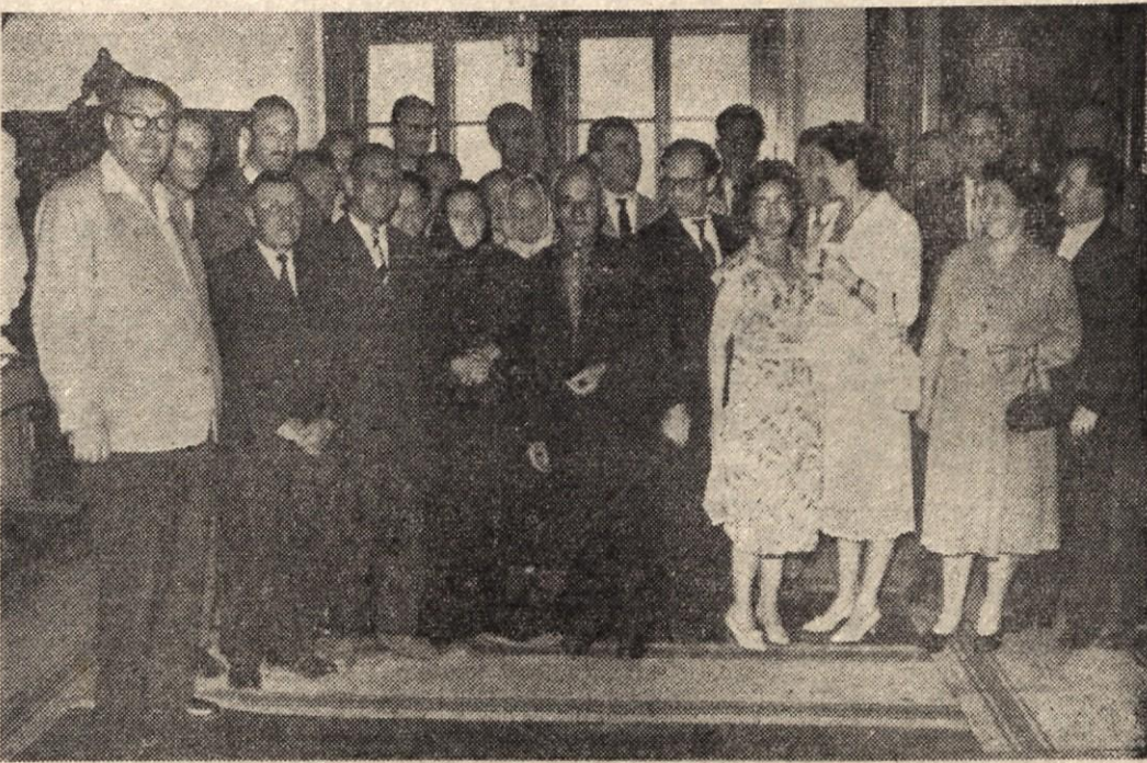
Kakor v letih med vojno, tako prihajajo voditelji naše revolucije in vseljudske vstaje tudi zdaj med ljudstvo, kadarkoli le utegnejo. Dober mesec je minil, ko smo v Novem mestu toplo sprejeli in pozdravili v naši sredi drage goste; v Dolenjskem muzeju je bil 19. junija sprejem za predstavnike Zveze borovc NOV in ZVVI našega okraja...

nutek nato se je zgradil prestreljenimi prsmi. Padel je na pragu svoje rojstne hiše. »Razbežimo selt je neko zakričal.