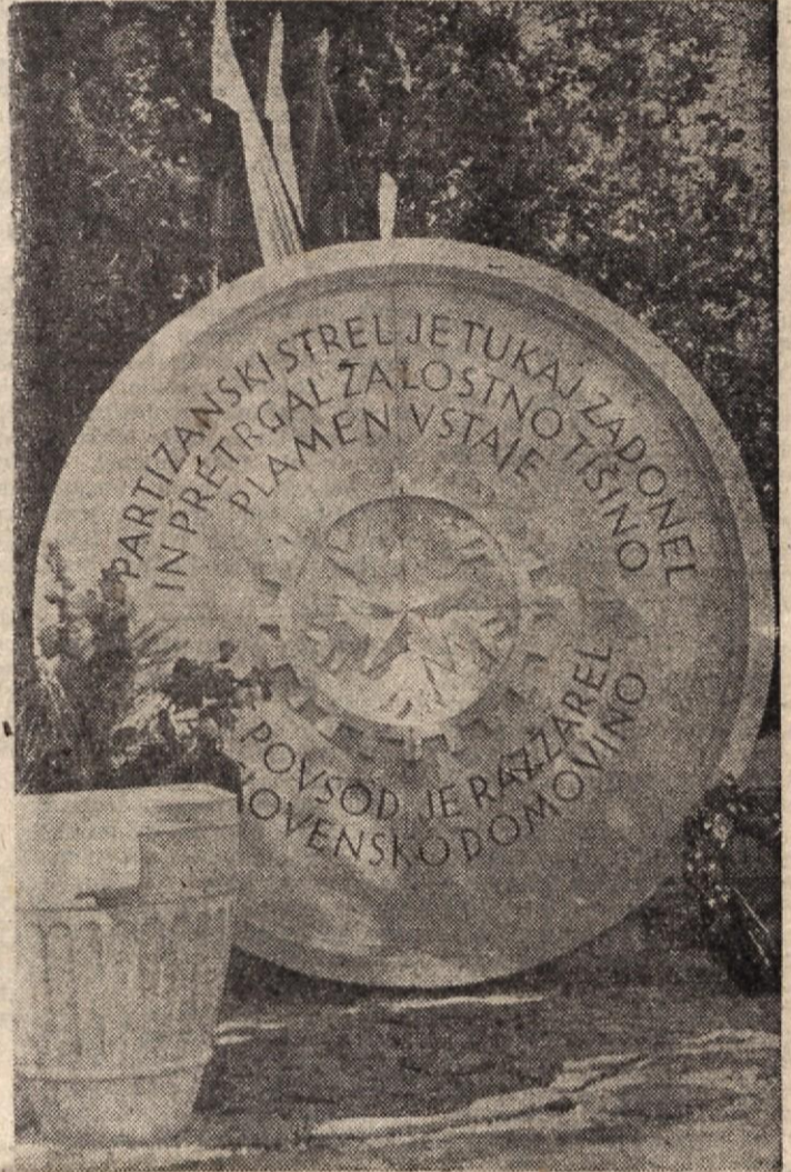
Julija 1957 so pri Šmarinem blizu Ljubljane odkrili na kraju, kjer je padel prvi strel proti okupatorju 22. 7. 1941, lep spomenik

kazujejo, da se je življenjska raven našega človeka že precej približala oni na razvitejših področjih. Opozoril sem na to, ker te stvari v naglici življenja radi prezremo. Mlada industrija daje kruh 2000 delavcem v občini. Le industrije, primerne za žensko delovno silo, še nimamo, zato imamo tu največ težav. Sicer pa je Bela krajina po vojni mnogo pridobila, naši borci se res niso borili zaman. V petih letih smo dosegli in naredili mnogo več, kot bi to lahko kdorkoli kdaj prej sploh v sanjah pričakoval. Pa ne samo to: še vedno gradimo, morda prav zdaj še najbolj, saj dobro vemo, da je šla naša pot vedno samo navzgor in naprej.