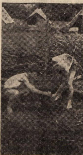
Jutri zvečer bodo ob tabornem ognju proslavili dan vstaje — zato bo pagoda še posebno skrbno pripravljena in visoka...

pravi črni zamorčki hočejo postati pionirji in pionirke, ki sušijo