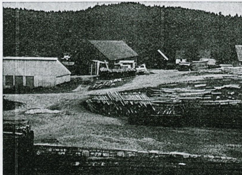
Motiv iz preteklosti