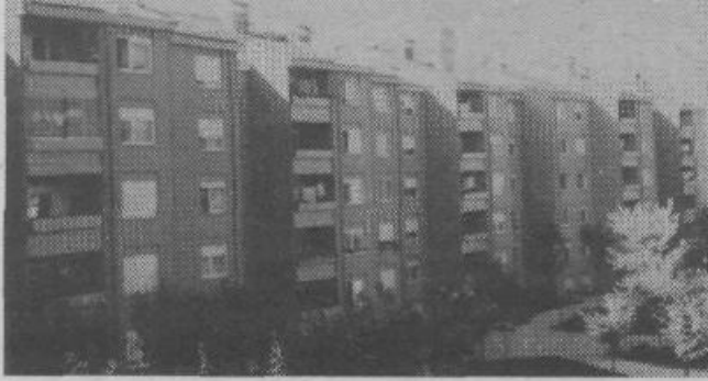
Poznojesensko popoldne.