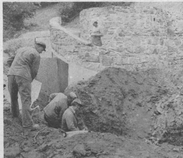
Na drugi ploščadi otroškega igrišča na Osojah bo zgrajena lična stavba s sanitarijami. Prvotni obrisi »grajskega sloga« zidave so že vidni.