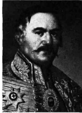
Knez Miloš Obrenović

Naenkrat pa je meseca marca l. 1848. izbruhnila evropska revolucija in Milošu se je zdelo, da je prišel njegov čas. Vkljub svoji pristno srbski zvitosti, ki je bila njegov naravni dar, preizkušen v diplomatski kuhinji dunajskega kabineta, pa Miloš ni opazil, da so bili vsi njegovi načrti že davno izdani. Tisti čas se je namreč pojavil na Dunaju Milivoj Petrović Blaznavac, mlad človek, ki je