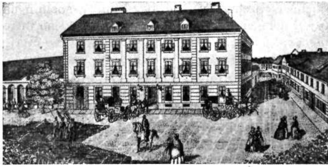
Bahabirt — hotel »Avstrijski dvor« na sedanjem Krekovem irgu (Mahrova hiša)