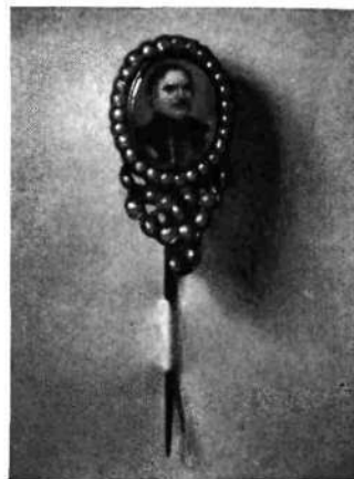
Dragocena spominska igla, ki jo je poklonil knez Miloš rodbini Karingerjevi.

Medtem ko so Ilirci v Beogradu razvijali najživahnejšo agitacijo, da gre srbska vojska v pomoč bratom onstran Save in Donave, je Milošev prihod