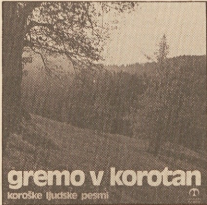
gremo v korotan koroške ljudske pesmi