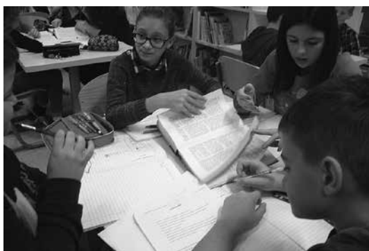
Slika 3: Iskanje besed po slovarju

rijevi, ne more ustrezno vrednotiti svojega dela. Pri opisani uri sem prvič vključila vrstniško vrednotenje, sicer v manjši meri, saj smo imeli na voljo le eno šolsko uro. Ob koncu ure so