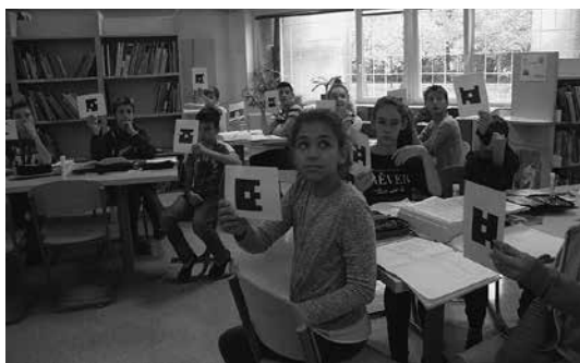
Slika 2: Učenci odgovarjajo preko aplikacije Plickers