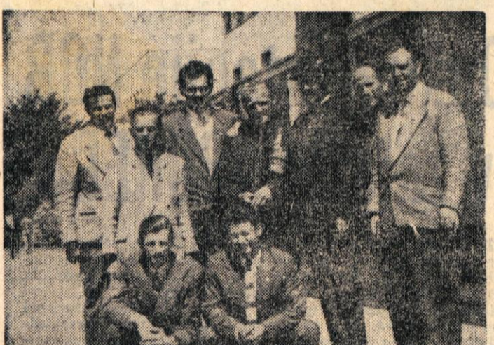
Naši tekmovalci z gosti v Titogradu

Tudi ženska ekipa ni izpolnila pričakovanj. Nekoliko oslabilena je zbrala manj točk kot v Litiji, toda prvo mesto v ligi ji navzile temu ni ožrtoženo.