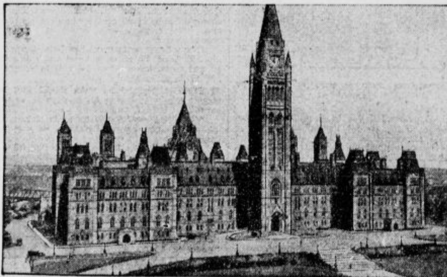
Parlament v Ottawi, glavnem mestu Kanade