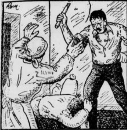
Mati je skočila k hčerki in doignila roke.

Srepa oči je uprl v Tilko, pljunil pred njo in zasikal: »Pocestna si! Ponošno se je vzravnala in izbruhnila: »Oče, ki hčer prodaja, nima pravice psovati!