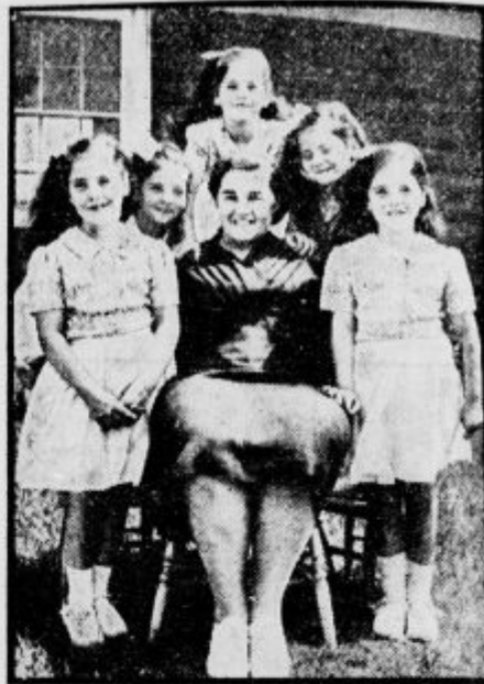
Svetovnoznane kanadske petorke okrog svoje mame