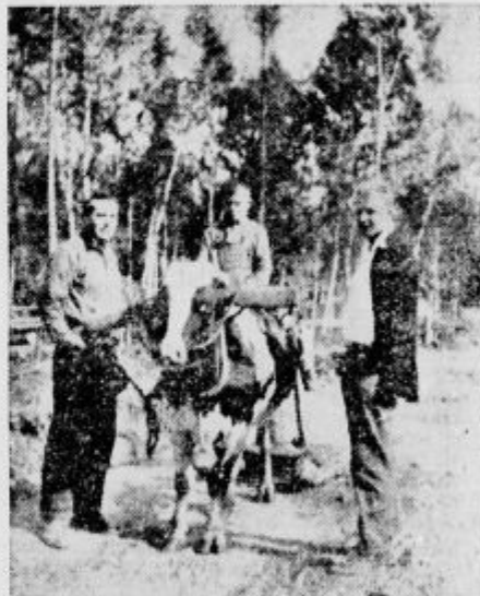
Tudi v Kanadi so kraji, kjer zmanjka vode, da jo morajo takole dovažati