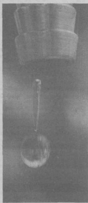
Če področja, ki so brez pitne vode, ne sodijo med razvita, pa prav gotovo sodijo med prikrajšana za eno od temeljnih dobrin

Sosednji krajevni skupnosti Zadvor in Bizovik sta se se spomladi 1974 lotili skupnega reševanja preskrbe z vodo in odvodnjavanja fekalnih vod, ker sta ugotovili, da pomeni združevanje dela pocenitev pri projektiranju in izvajanju kanalizacije.