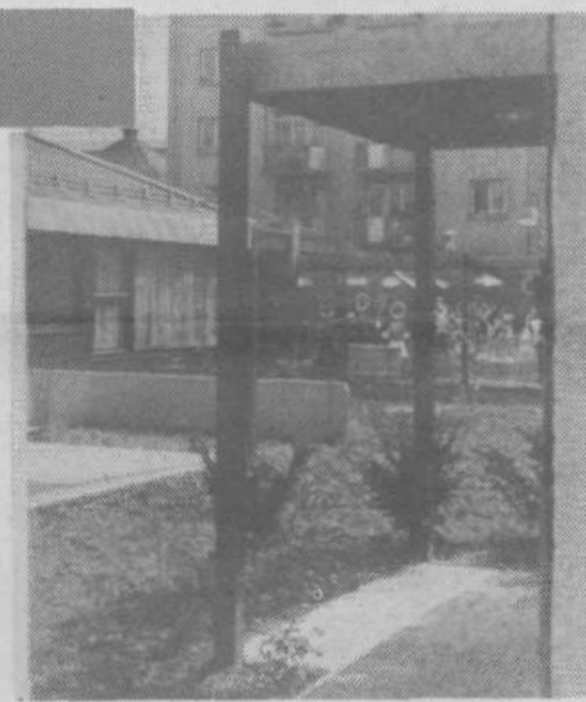
Del novega VVZ Selo v KS Moste

zasluga tudi krajevni skupnosti, posebno njeni komisiji ter gradbenemu odboru, ki je vseskozi bedel nad deli in s svojimi akcijami pospeševal gradnjo. Zato gre tovarišam in tovarišem, ki so v odboru sodelovali, vsa zahvala.