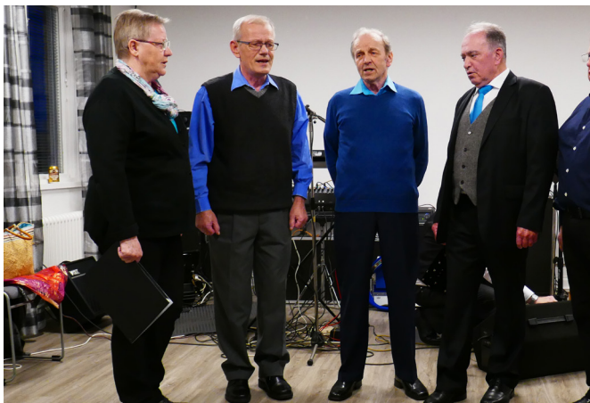
Nastopil je tudi Pevski zbor Planika Malmö.