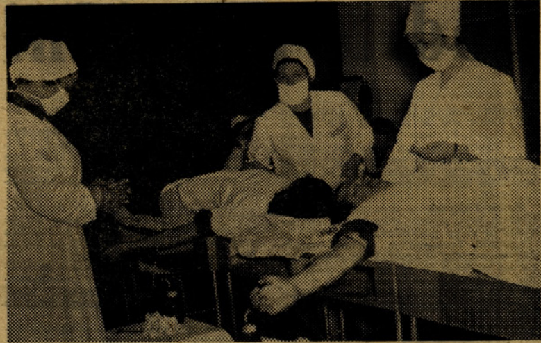
Zdravstveni delavci in darovalci pri zadnji akciji

Po izvolitvi namestnikov članov upravnega odbora so imenovali še člane nekaterih komisij, ki so zakonsko določene.