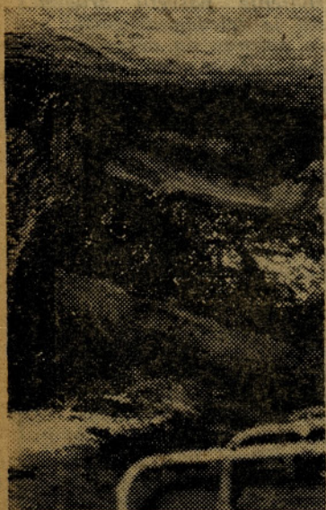
Po teh klinih se je hotel Krajšek vzpeti iz jaška...