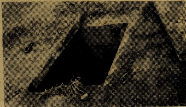
Vhod v jašek pri vodni črpalki

Na kraj nesreče je kmalu prišla tudi komisija, v kateri sta bila poleg organov tajništva za notranje zadeve tudi preiskovalni sodnik in tožilec. Na kraju samem so opravili potrebne meritve in zaslišali očitve.