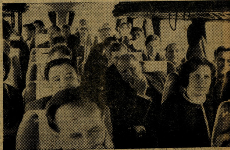
Člani upravnega odbora med vožnjo po Italiji