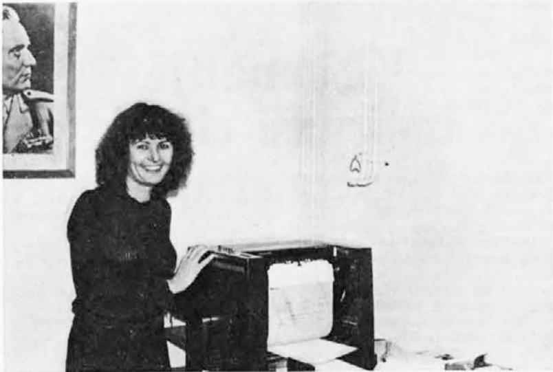
Jo poznate, našo Melanijo, iz enega papirja jih nareči lahko čez tisoč