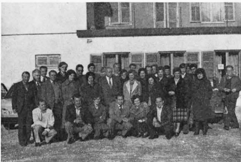
Dve leti dela, odločanja in predlaganja ter sprejemanja samoupravnih aktov — to so bili naši delegati v delavskem svetu delovne organizacije

V letu 1980 želimo vsem delavcem obilo zadovoljstva in delovnih uspehov