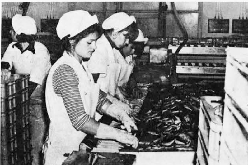
V TOZD Delamaris, delavke na predelavi ribe