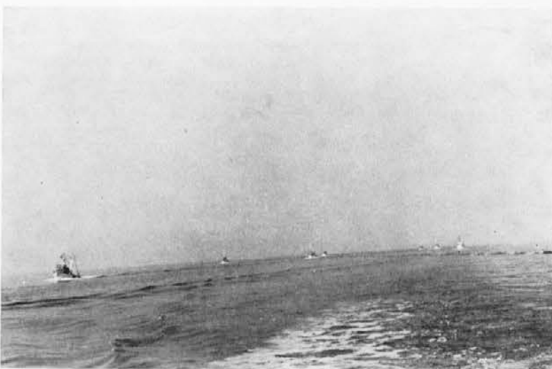
Bodočnost našega ribištva je v nabavi novih ladij, kjer se bo ulov vršil z novo tehnologijo

Izdelana je bila tudi tehnična in tehnološka dokumentacija v celoti. Tovarna naj bi bila zgrajena v času od 1. 1. 1980 do 30. 4. 1982. Vrednost investicije znaša 1.072.477.459 din, od katerih bi del prispevali mi, del sovlagatelji, del sredstev pa naj bi koristili od sredstev iz vzajemnega združevanja vseh temeljnih bank. Rešili smo tudi problem energetskih virov, tako da bi v začetku koristili električno energijo iz omrežja in plin, kasneje pa bi se