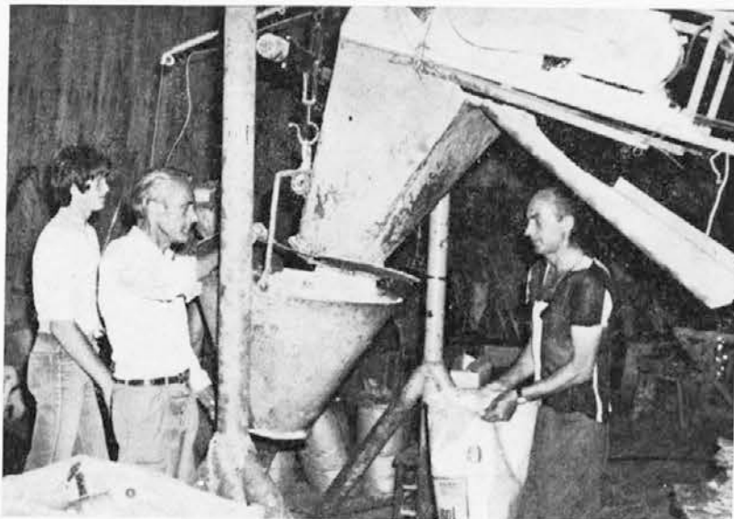
Delavci pri delu v tozd Soline

Za ureditev 142 ha nasadov hrušk, 50 ha breskev in 200 ha vinogradov ter 200 ha zelenjavnih površin bi potrebovali sredstva