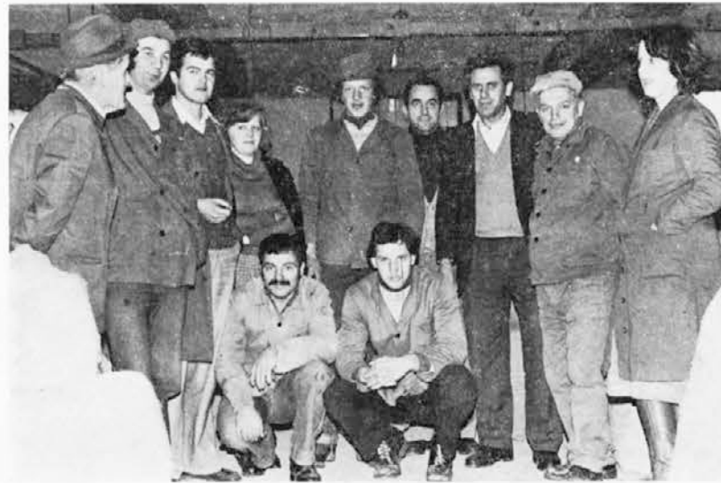
Posnetek delavcev na odkupni postaji Most na Soči