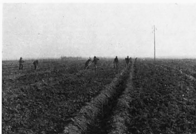
V sečoveljski dolini delavci TOZD Kmetijska proizvodnja uresničujo sprejete naloge, zasadili bodo hruške