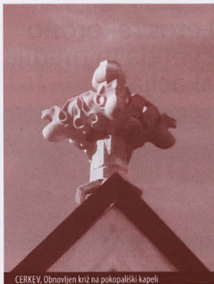
CERKEV. Obnovljen križ na pokopališki kapele

V drugi polovici leta smo začeli govoriti o evharistiji. Prihodnje leto bo slovenski evharistični kongres, na katerega se bomo pripravljali tudi v