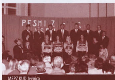
MEPZ KUD Jevnica

Povabili smo kar naše pevske kolege, ki smo jih spoznali na naših nasto-