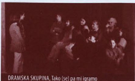
DRAMSKA SKUPINA, Tako (se) pa mi igramo

Dramska skupina župnije Črni Vrh bi za preteklo leto lahko rekla, da je bilo naporno, a uspešno. Po nastopih z igrico, ki smo jo pripravili za Miklavžovo obdarovanje, smo se naučili božični prizorček in z njim na božični dan popestrili dogajanje oskrbovancem v črnovrškem domu za starejše občane. Starejši svojega veselja nad nadobudno mladežjo niso mogli prikriti. Prav zaradi tega je bil božič tudi za nas posebno doživetje. Začutili smo tisti pravi mir in veselje ob darovanju svojega časa in talenta za druge. Potem smo se zavzeto pripravljali na prireditev ob materinskem dnevu, ki pa na žalost ni bila obiskana v tako velikem številu.