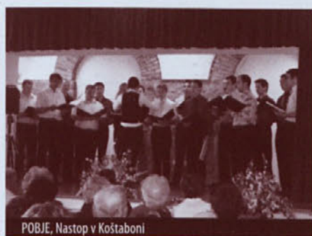
POBJE, Nastop v Koštaboni