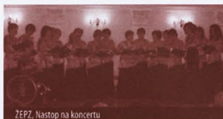
ŽEPZ, Nastop na koncertu