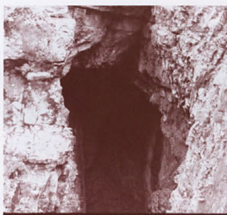
KULTURNA DEDIŠČINA, Kalarjev ledenik

»Kalaunk« je bil vrč iz nagnojevega lesa, ki je bil na eni strani obtežen, da so z njim lahko zajeli vodo.