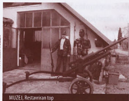
MUZEJ, Restavriran top

tega obdobja in s tega teritorija. Tudi ta muzej toplo priporočam vsem, ki jih ta tematika zanima. Morda ravno prav za popestritev kakšnega zimskega popoldneva.