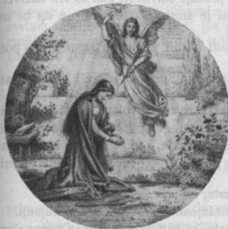
Angeo Gospodov je nazvesto Mariji i je poprijela od sv. Düha: Zdrava Marija, milošče puna.

siromaštva. Sveti mož je odbio te peklenske napade, ali vznemirjala ga je skrita bolečina zavolo Marijinoga stanja. Prečista Devica je znala vse, ka se dogaja v srci sv. Jožefa. Molila je presvetoga Sina, naj njemi zavolo te bolečine prizanese z vsakov drügov brigov i teškočov. Lucifer je naprej navalüvao z vsemi do teh mao upotrebrenimi napadi, ali ona je ostala i te nepremična. Bila je osvedočena, da je odrejena za to, da ponizi i stere Luciferovo gizdo. Z visikim veličanstvom se zdigne nad hüdožne dühove i zapita: