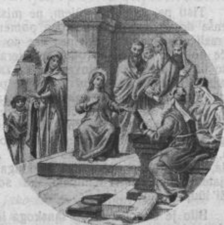
Naša Mamika i naš Ajtek z potrjim srcom iščeta Jezuška tri dni i ga z veseljem najdeta v cerkvi.

Tri dni sta ga jočič iskala i tečas ne odnehala, dokeč ne sta ga najšla v jeruzalemskoj cerkvi, naj pokažeta stanovitnost v iskanji Boga. Sv. Jožef bi rad doživo Jezušovo diko, kda reši svet, ali Bog je odločo, da prle vmerje. I popolnoma vdano je sprejeo boži sklep, kak tudi Marija, ki je mogla navzoči biti pri trplenji Sina Odrešenika i pri njegovom groznom vmiranji i ne njemi je smela pomagati. Nad vse podignjeno mučeništvo oba!