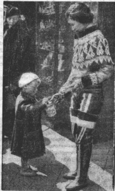
Na Danskem prirejajo vsako leto dneve zbiranja milodarov za siromake. Slika nam prikazuje nabiralke v slikoviti grönlandski narodni noši, ko prejema dar mladega dobrotnika