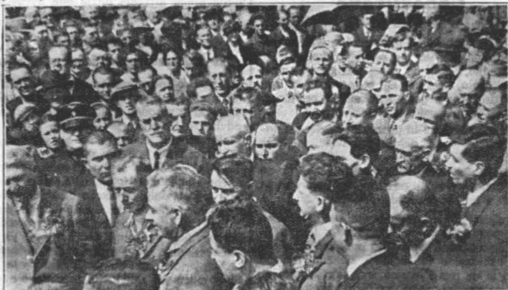
Bolgarski železničarji v Sloveniji. Slika prikazuje svečan sprejem na glav. kolodvoru v Ljubljani.

Kljub temu sklepu pa je eden izmed njih že prišel v narodno skupščino, zavedajoč se svoje dolžnosti. Kajli narod ga je izvolil za to, da bo delal in pomagal ljudem, ne pa doma zabavjal in zmerjal. Prepričani smo, da bodo temu sledili še drugi, kdorkoli čuti le trohico odgovornosti, ki jo ima nasproti narodu in državi.