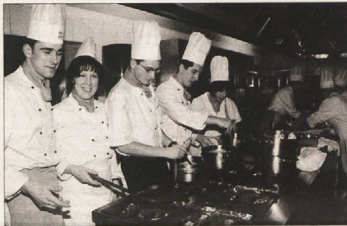
KUHARJI ŠTUDENTJE - Kuharice in kuharji so vedno najbolj "skriti" del gostinske ekipe. Na fotografiji: študentska kuharska ekipa, ki je gostom v grajski restavraciji na Otočcu pripravila projektno nalogo z naslovom VINO in hrana se vam izpovedujeta.

"Najbolj zahrbtna laž je izpustitev česa." (SIMONE DE BEAUVOIR)