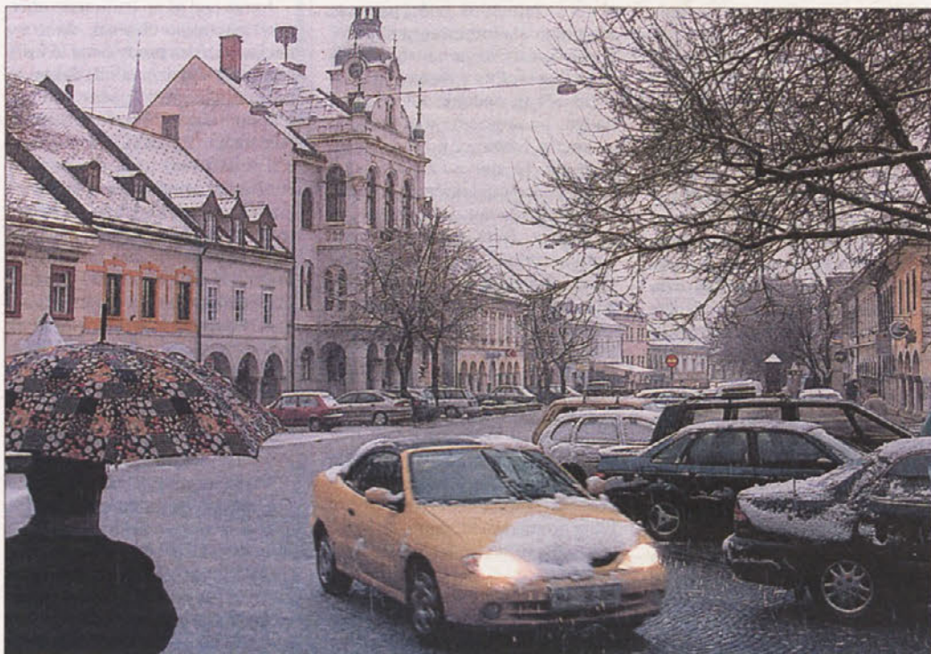
ZIMA NA OBROKE - Letošnja zima je nekakšna čudna vremenska mešanica jeseni in pomladi. S starčevsko muhavostjo nam le tu in tam ali dva natrosi nekaj snežink, toliko pač, da "starka zima" upraviči svoj pridevek "bela" in da ne pozabimo, kaj je sneg. Napovedi vremenarjev o sneženju po vsej Sloveniji v začetku tega tedna so se uresničile le za južni del domovine. Dolenjci in Belokranjci so se tako v torek, 30. januarja, zjutraj prebudili v pravo zimsko razpoloženje. A so pleteče snežinke stale bolj rahlo snežno odejo, voznikom in cestarjem v zadovoljstvo, otrokom in ljubiteljem zimskega veselja pa v ponovno razočaranje. Na sliki: torkovo zimsko jutro na Glavnem trgu v Novem mestu.

Št. 5 (2684), leto LII • Novo mesto, četrtek, 1. februarja 2001 • Cena: 240 tolarjev