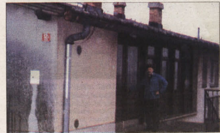
ŠOLSKA STAVBA NA TELČAH - Odprli so jo 31. avgusta 1969, začasno pa je bila šola ukinjena 1987. leta.