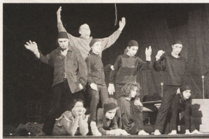
Celotna igralska ekipa Rata Mahata express cabareta se je na koncu takole poslovila od občinstva.