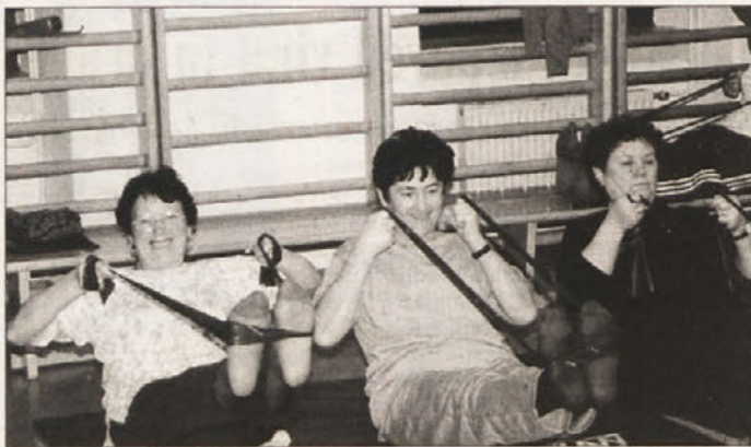
Pri nekaterih vajah si telovadke pomagajo s trakom.