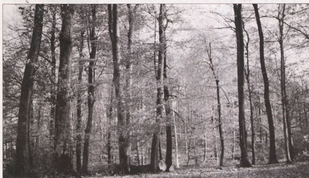
ALI SEKAMO DOVOLJ? - Sečnja v zasebnih gozdovih zaostaja iz različnih razlogov, na prvem mestu pa je gotovo prenikna cena hlobovine, še posebej slabšega in drobnejšega lesa.

Na Dolenjskem v zadnjem desetletju sečnja narašča, saj so leta 1991 posekali 208.000 in predlani 280.000 kubikov lesa. V državnih gozdovih se seka skoraj toliko, kot je načrtovano, v zasebnih pa dosti manj. Kot pravi Pečavar, je razlogov več. Med drugim so zasebni gozdovi revnejši, saj se v državnih pozna 100-letno načrtno gospodarjenje, medtem ko so bili zasebni gozdovi že pred vojno zaradi golosekov zelo revni. Za Dolenjsko je značilna še velika razdrobljenost gozdov, saj je povprečna velikost gozdne parcele komaj 0,7 ha, medtem ko ima povprečen lastnik v lasti 3 ha gozda. Zaradi naštetega posamezni lastniki niso gospodarsko tako zelo odvisni od gozda,