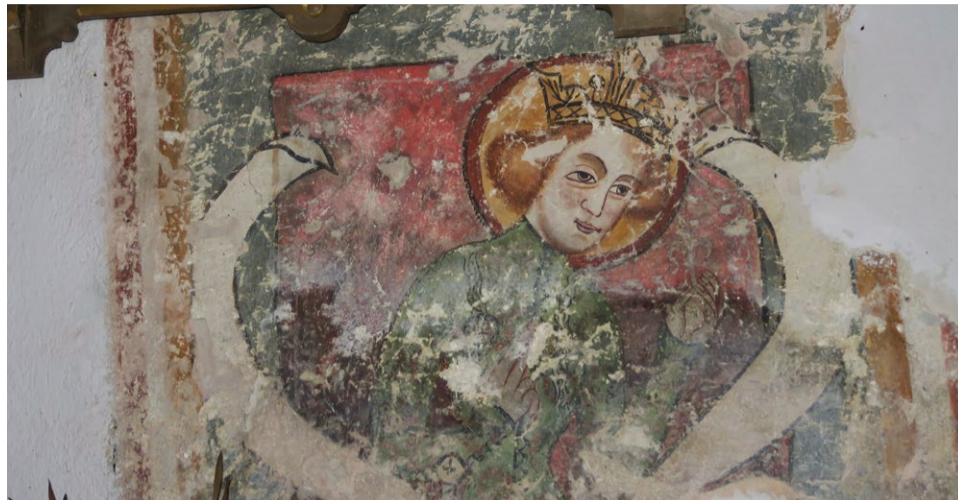
Del notranje freske

Predstavitve sakralnega objekta v Odloku poudarja najpomembnejše podatke. Cerkev stoji na desnem bregu reke Krke, prav blizu mostu. V pisanih virih se prvič omenja l. 1526, čas njene postavitve pa sega v 13. stoletje, ko se je razširilo čaščenje sv. Nikolaja kot zavetnika ribičev in čolnarjev. V 14. stol. so ladji cerkve prizidali prezbitarij. Večje predelave notranjosti je cerkev doživela v 17. stol., leta 1911 pa žal nestrokovno obnovo, ko je bila porušena severna stena z ostanki gotskih fresk. Cerkev danes sestavljajo pravokotna ladja z ravnim stropom. Na zahodni strani je ohranjena najstarejša freska iz 14. stol., ki prikazuje Kristusovo čudežno hojo po Nazareškem jezeru, sv. Nikolaja, svetnico in neko donatorico. Najbolje so ohranjene freske iz sredine 15. stol., ki jih pripisujejo Janezu Ljubljanskemu. V prezbitariju so še vidne upodobitve svetnic in apostolov, v ladji pa nekaj prizorov iz Kristusovega trpljenja. Cerkev se uvršča med pomembnejše spomenike srednjeveškega slikarstva na Dolenjskem.