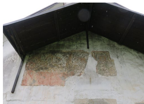
Freska Vihar na morju