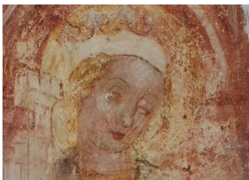
Del notranje freske