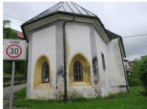
Vzhodni del cerkvice sv. Miklavža