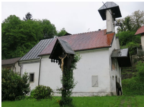
Cerkev sv. Miklavža