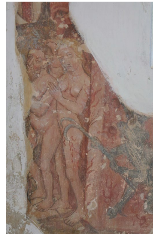
Adam in Eva