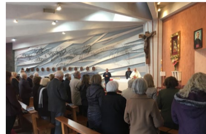
Slika Tone Malovrh

V Cerkvenem življenju povsod po svetu je zelo posplošena navada, da je dan zavetnika cerkve, ali pa na obletnico blagoslova farne cerkve, velik praznik, ki združuje versko bo-