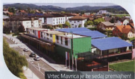
Vrtec Mavrica je že sedaj premajhen!

Vodstvo vrtca je staršem predlagalo, naj sami poskusijo najti prostor, kjer bi se naj čuvali njihovi otroci, kader, ki bi jih varoval, pa naj ne bi bil problem. Tako so se starši za pomoč obrnili tudi na naš medij, saj se želijo združiti, nato pa na Občino Trebnje oddati vlogo za odprtje nove skupine vrtičkarjev. Kje bo le-ta