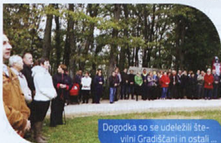
Dogodka so se udeležili številni Gradiščani in ostali ...

Julija letos so denimo v Gradišču organizirali veliko prireditev, 14. srečanje Gradišč Slovenije, ki je bila vzorno organizirana in odlično obiskana, pred tem dogodkom pa so se seveda zvrstile številne delovne akcije, da so svoj raj na Zemlji lahko predstavili v kar najlepši možni luči. Gradiščani so prestavili tudi svoj hram, pa drevo zgodovine in nenazadnje še table, ki vse mimoidoče spremljajo po poti teh čudovitih vinskih gor. V celoti so obnovili ter preplekali – znotraj in zunaj – cerkev Sv. Jožefa, le-ta pa je dobila tudi nova vrata. Za nameček je Društvo vinogradnikov Trebnje v Gradišču postavilo tudi brajdo s potomko najstarejše vinske trte z mariborskega