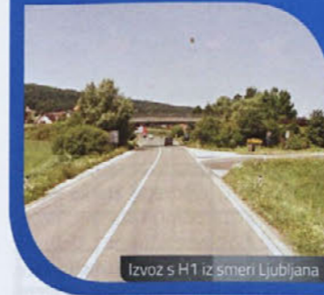
Izvoz s H1 iz smeri Ljubljana