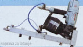
naprava za latanje

Kupovanje pri nas je cenejšo, pripravite se!