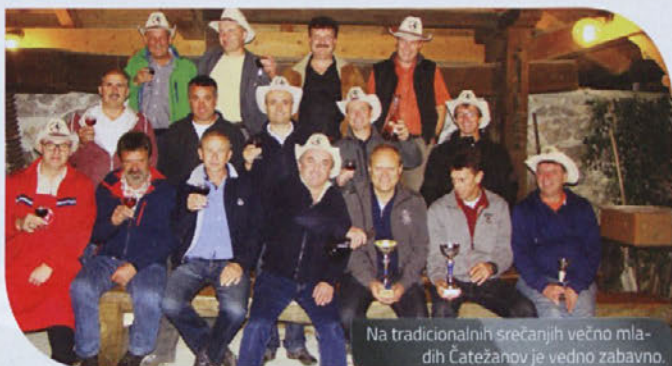
Na tradicionalnih srečanjih večno mladih Čatežanov je vedno zabavno.

Tudi letos so se "večno mladi Čatežani" zbrali na tradicionalnem srečanju, ki je letos potekalo 17. oktobra 2014 v Ravnikarjevi zidanici.