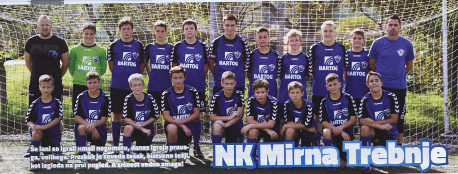
Še lani so igrali »mali nogomet«, danes igrajo pravega, velikega. Preskok je sveda težak, bistveno težji, kot izgleda na prvi pogled. A srčnost vedno zmaga!