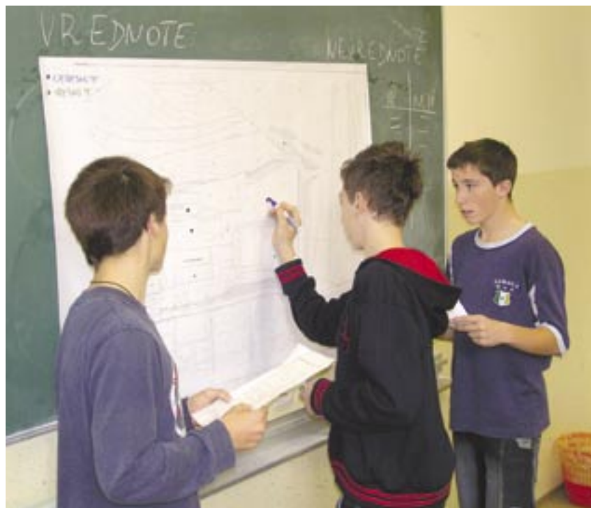
Na terenu zaznane vrednote prostora – poročanje.