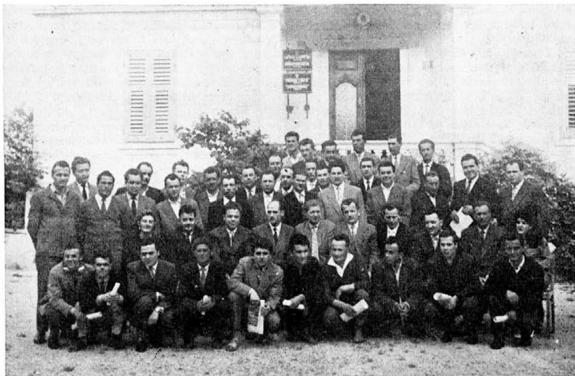
Slušatelji politične šole v Izoli s predavatelji in upravnikom ob zaključku šolskega leta

Spričo tolikšnega števila mladine v Izoli bodo mladinski aktivni zlahka našli dovolj uka željnih mladincev, pri čemer bi se lahko izognili dijakov iz osemletke.