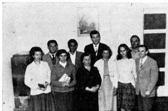
Naši odlikovanci na ObLO Izola ob svečani izročitvi odlikovanj

željo, da bi jim ob letu sledili novi junaki dela.