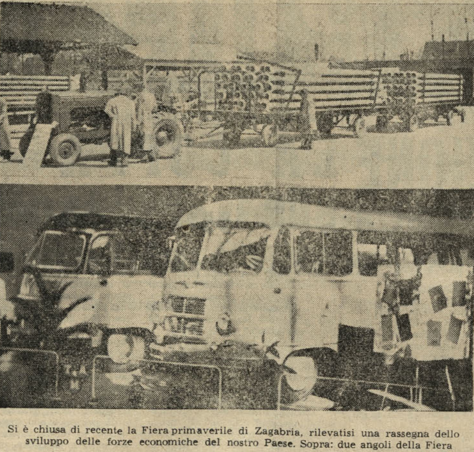
Si è chiusa di recente la Fiera primaverile di Zagabria, rilevatisi una rassegna dello sviluppo delle forze economiche del nostro Paese. Sopra: due angoli della Fiera

INSEGNANTE - Oggi parliamo ancora una volta di Tom Grey e di sua sorella Joan. Di solito, essi non giungono insieme per registrare le nostre lezioni. Joan arriva per prima, generalmente presto. Joan comes early. Tom arriva spesso in ritardo. Tom comes late.