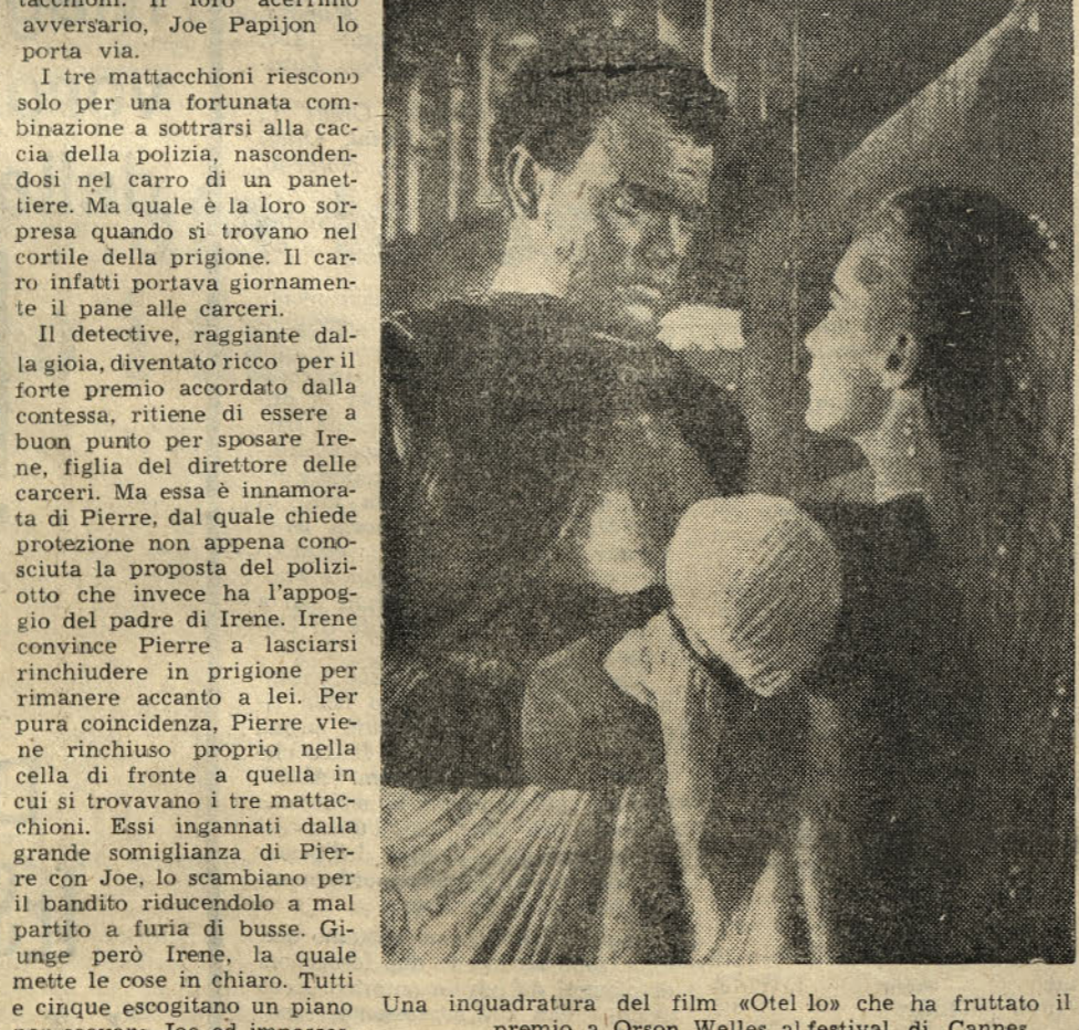
Una inquadratura del film «Otel lo» che ha fruttato il premio a Orson Welles al festival di Cannes

lo svaligiamento di un noto istituto di bellezza, preparata, in precedenza da Joe. Il loro trucco viene scoperto. I tre mattacchioni vengono catturati dai banditi, mentre Irene e Pierre riescono a fuggire.