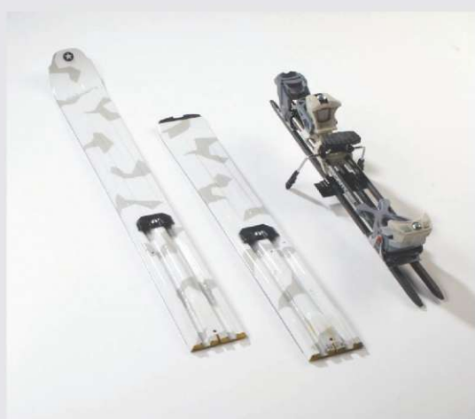
Razstavljiva turna smučka

V času od 2. do 3.12.2010, smo predstavniki razvojnega oddelka SKI, na Forumu inovacij predstavili inovacijo - razstavljivo turno smučko. Na Forumu inovacij je bilo skupno prijavljenih skoraj 200 inovacij. Naša inovacija je prišla v krog 50 najboljših, ki so se na forumu podrobneje predstavile. Forum si je ogledalo veliko pomembnih ljudi, med drugim tudi predsednik vlade Borut Pahor in minister za visoko šolstvo Gregor Golobič. Skoraj vsem obiskovalcem se je zdela naša inovacije zelo zanimiva in funkcionalna. Ljudje so dajali različne komentarje, kot npr. "ta vaša inovacija se mi zdi tako dobra, kot takrat ko so prišle na trg teleskopske palice". Razstavljiva turna smučka je rešitev težav turnih smučarjev, saj klasične smuči predstavljajo oviro pri gibanju. Razstavljiva turna smučka se v ključnih trenutkih lahko razstavi in zloži v nahrbtnik.