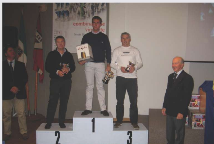
Najboljši na Barcolani