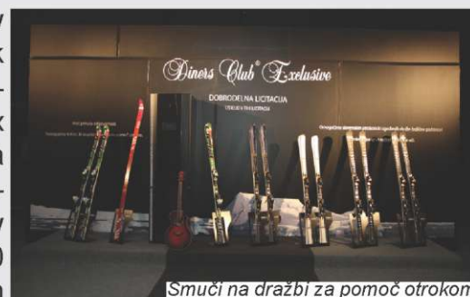
Smuči na dražbi za pomoč otrokom

V družbi slavnih je potekala vsakoletna Dinersova prireditve, v sklopu katere se že tradicionalno zbira denar za zimovanja otrok iz socialno šibkih družin. Elan je za dražbo, ki je bila v ponedeljek, 13. decembra, namenil pet parov smuči (SLX Waveflex F, St. Moritz SL, smuči Black Carbon s podpisom ameriškega igralca Kevina Costnerja, smuči Diners Club Exclusive ter osebno smučko Ingemarja Stenmarka, s katero je leta 1982 zmagal v Kitzbuhelu). Z licitacijo predmetov na dražbi smo zbrali 10.001,00 EUR, poleg tega pa je bilo možno donirati tudi direktno na račun Dinersa ter Zveze prijateljev mladine Slovenije. Zbranih je bilo 23.000,00 EUR, donacije pa še potekajo. Z zbranimi sredstvi bo Zveza prijateljev mladine Slovenije na zimovanje peljala vsaj 143 otrok, ker pa se znesek še zmeraj povečuje, upamo da bo ta številka še nekoliko višja. Prvih 32 otrok bo zimovalo že v času novoletnih počitnic in sicer v Domu Miloša Zidanška na Mariborskem Pohorju, ostale skupine pa bodo odšle na zimovanje v času zimskih počitnic na lokacije po vsej Sloveniji. Z zbranim denarjem na dražbi je tako tudi Elan razveselil nekaj otrok.