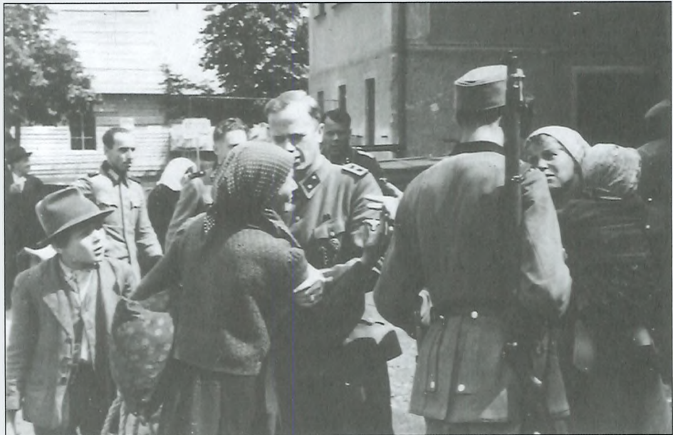
Ločitev mater od otrok, avgust 1942.