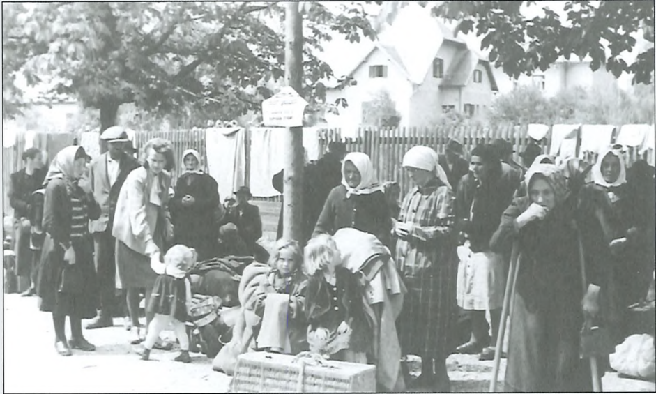
Matere z otroki na dvorišču okoliške šole v Celju, avgust 1942.