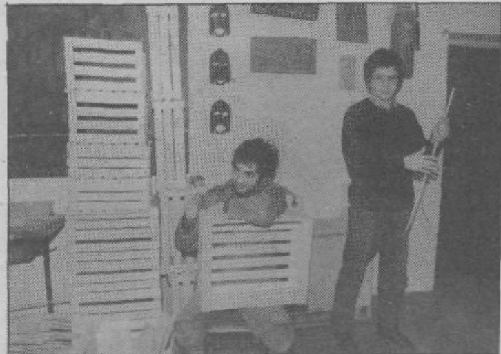
V delavnici v Mostah spretno in pridne roke deklet ustvarjajo lepe šivane izdelke, fantje pa obdelujejo predvsem les in delajo iz njega košarice za kruh, gajbice, večje ali manjše, ter še druge podobne predmete, ki jih občudujemo tudi v naših trgovinah.

Med njimi je vrsta ljudi, ki bi jih bilo mogoče usposobiti za delo pod posebnimi pogoji (torej ne z uvaja-