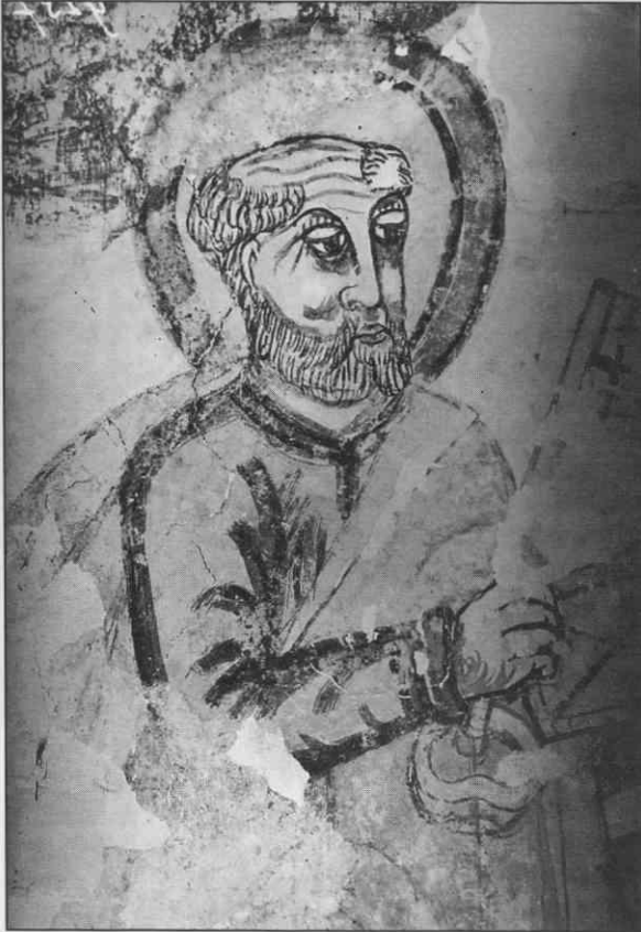
Uničena freska - Glava apostola Petra, podružnična cerkev sv. Jurija, Novi Lazi, pozno 16. stol.

strije in velikonemške ideje. Razsežno župnijsko svetišče v Kočevju bi lahko bilo sedež škofa 39 , če ne bi desetletje kasneje prišle v deželo hude preizkušnje, prva svetovna vojna, nova slovanska država in druga svetovna vojna. Cerkev je bila nenadoma prevelika za spremenjeno funkcijo kraja in je postala simboličen Dunaj v malem.