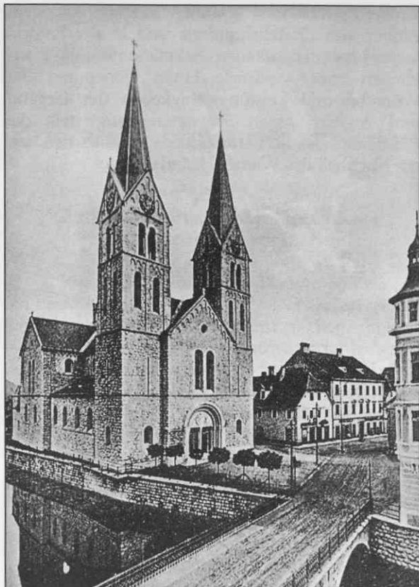
Zunanost župnijske cerkve sv. Jerneja, Kočevje (prej sv. Sebastjana in sv. Fabijana) Friedrich von Schmidt, 1903

Trdo delo in navezanost na zemljo sta pomagala skozi viharje.