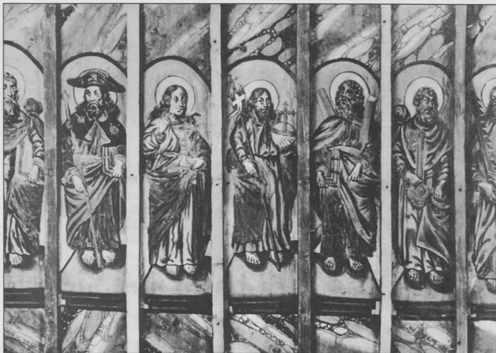
Uničeni detajl stropne figuralne poslikave, podružnična cerkev sv. Andreja, Kleč, 17. stol.