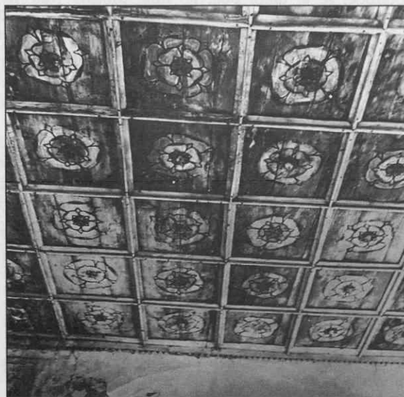
Odstranjeni leseni poslikani strop, podružnična cerkev sv. Nikolaja, Videm, 16. stol.

je bila vrh umetnostnega razvoja na Kočevskem in njegov labodji spev, bila je zrcalo razvoja indu-