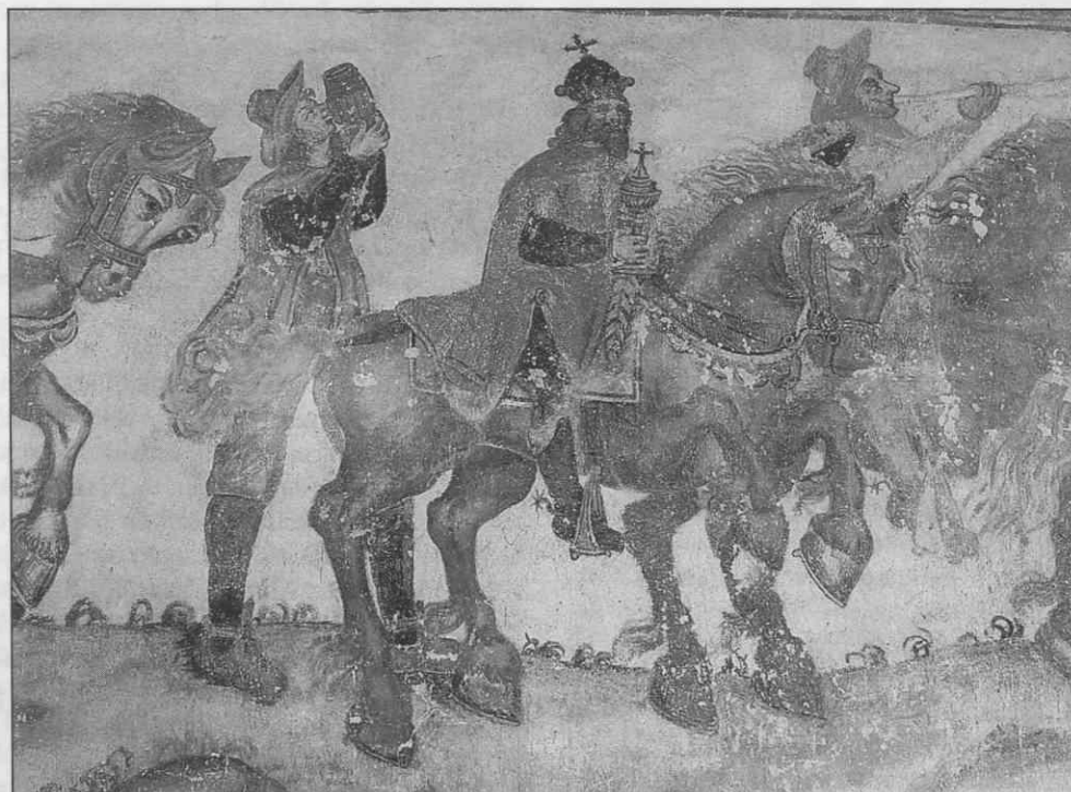
Freske na severni steni podružnične cerkve sv. Treh kraljev, "Mojster Martina Krpana", Črni Potok, pozno 16. stol. (foto Gojko Zupan, 1995)