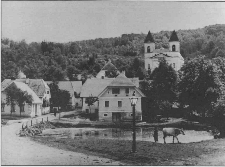
Vas in dominantna dvostolpna cerkev, župnijska cerkev Žalostne Matere božje, Nemška Loka, 1763

priklonil pred Herodom 33 . Ob jezdecih hodi par spremljevalcev. Izrazitejši oproda v modrem oblaku spominja na Petra Klepca z dolgimi, rdečimi dokolenkami. Baročno razgibana je stoja konj, ki se vzpenjajo. Poznavalci postavljajo nastanek teh podob v pozno 16. stol. 34 Za slikarja, ki je slikal te podobe, se je takoj pojavilo ime: Mojster Martina Krpana. Velike, okorne figure spominjajo na Kraljeve 35 ilustracije, ki so nastale tri stoletja kasneje. Verjetno so slikali podobe pred rezbarjenjem oltarja, največ desetletje pred 1580 36 . Ikonografska posebnost je povezava slikanih prizorov in rezljanega zlatega oltarja v kontinuirano zgodbo.