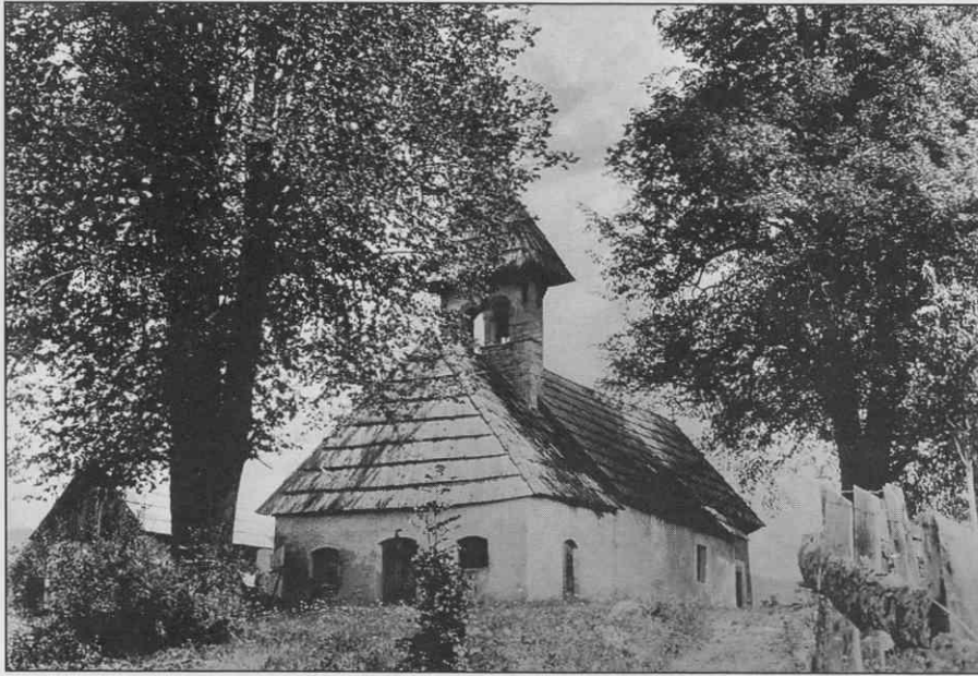
Podrta zunanost cerkve z zaprto lopo in zvončnico, podružnična cerkev sv. Trojice, Rajndol, 17. stol.

gure glavnega oltarja v župni cerkvi v Mozlju, ki še skrivajo pravega avtorja. Kipi iz Mozlja 26 ter Kočevske Reke 27 govore, da je območje imelo umetnine, ki so uvrščene v vrh slovenske kulturne dediščine svoje dobe. Posebnost, ki sodi v vsak pregled slovenskega baroka, sta stranska oltarja v mozelski župni cerkvi. Med boljša uvožena izdelka sodita še sliki Jurija Šubica. Na stranskem oltarju v Osilnici je stala oljna podoba Poklona sv. Treh kraljev in njej nasproti znova zdravnika sv. Kozma in Damijan 28 . Očitno sta bili podobi naročeni za konkreten prostor. Uvoženi, leta 1887 naslikani sliki sta ostali brez neposrednih naslednikov v svoji cerkvi in okolici.