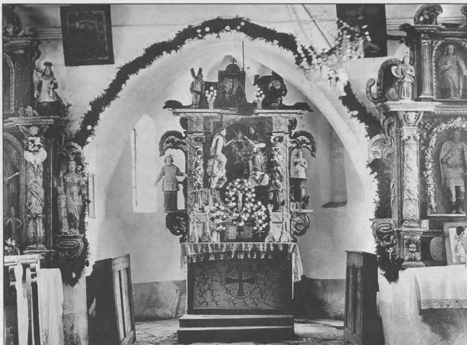
Uničena notranjost s slavoločno steno podružnične cerkve sv. Trojice, Rajndol, 17. stol..

razglednih pomolih. Pri gradnji in krašenju cerkva je šlo često za podzavestne odločitve, kjer je vplivala sestava prebivalstva. V podobno revni Beli krajini se je v arhitekturi, najbolj v stavbnih lupinah, v poznem 17. stol. razživel barok. Na območju Kočevja se je pojavil nekaj kasneje zgolj v redkih reprezentančnih prezidavah in nekaj čebulastih kapah zvonikov ob romarskih poteh. Zasnova Nove Štifte je odmevala na Vinjem vrhu. V vmesnem prostoru je podobno obliko dobil le par kapel. Še danes najbolj znani, akademsko šolani kipar področja teše kipe s sekiro; njegovi kolegi izven regije rezbarijo z dleti 10 . Če bi v likovni pregled vključili zgolj vrhunske izdelke, ki izvirajo z območja ali so zašli na Kočevsko, bi bila slika ustvarjalnosti izkrivljena. Na drugi strani običajni likovni izdelki Kočevskega redko presegajo nivo ljudske umetnosti. Vsi so dragocena priča medsebojnih oplajanj "vrhunskega ustvarjanja" in želja ter zmogljivosti province. Likovnost med Rinžo in Kolpo je zastala, enako kot je obstal razvoj rastlinja v hladnih kraških vrtačah. Biologom so pasovi endemičnega ledenodobnega rastlinja dragocen laboratorij. Enako se je pokazalo pri pričah umetnostne preteklosti, ki so vez med posameznimi minulimi dobami. Zato sem avtohtono likovno ustvarjalnost Kočevskega poimenoval Endemitska umetnost.