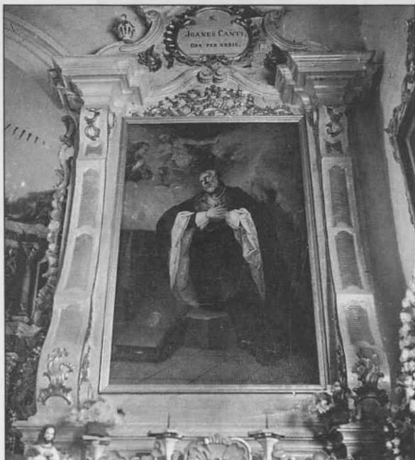
Uničen glavni oltar cerkve v Dolgi vasi, bližina Valentina Metzingerja, okoli 1750