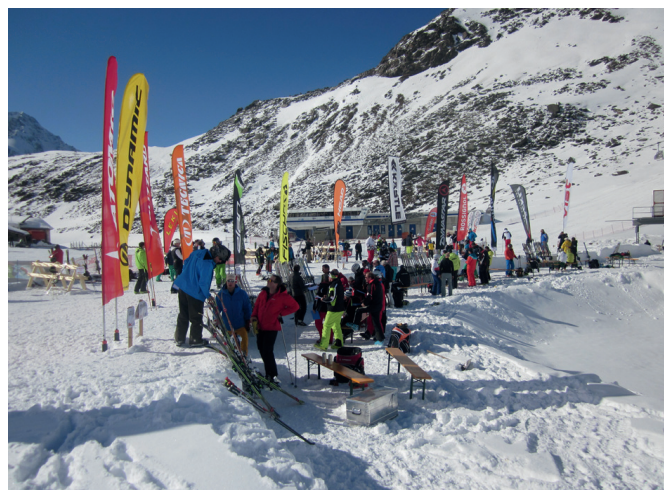
Ski test v italijanskem Suldhnu

Vozne lastnosti in vrhunska funkcionalnost Elanovih smučí sta poleg inovativnosti in dizajna ključnega pomena za uspeh na trgu. Elan se je tudi letos udeležil vseh večjih svetovnih testov revij, kjer vedno znova dokazuje, da sodijo naše smučí v sam svetovni vrh. Lansko leto je inovacija Amphibio predvsem na račun izjemnega produkta Amphibio 14 zmagala prav na vseh testih. Serija Amphibio pa je tako potrdila položaj največkrat nagrajene tehnologije, kar se odraža tudi v dobrem odzivu trgovcev in prodajnih rezultatih. Verjamemo, da bodo tudi letošnji rezultati to potrdili, saj smo podvojili število Amphibio modelov smučí v kolekciji. Prav zanimivo je bilo opazovati testerje, ki so z zanimanjem poslušali razlage tehnologije Amphibio in seveda predvsem uporabnosti na terenu.