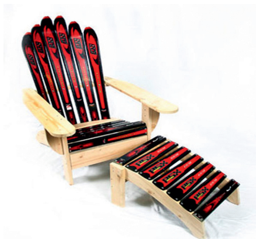
Primerek stola, ki ga so ga naredili v ZDA

Predloge sprejemamo v marketingu (1. nadstropje, int. 269) do 1. junija 2012. Predlogi bodo simbolično nagrajeni.