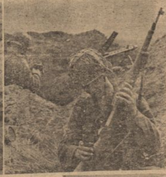
PK-Kriegsb. Witt (Sch)

In einer Kampfpause Wenn das Toben der Abwehrschlacht für kurze Zeit nachläßt, benutzen unsere Soldaten die Pause, um entweder den neuesten Brief aus der Heimat zu lesen oder das Gewehr, den treuen Begleiter des Soldaten, einer kurzen, aber gründlichen Reinigungsunterziehung.