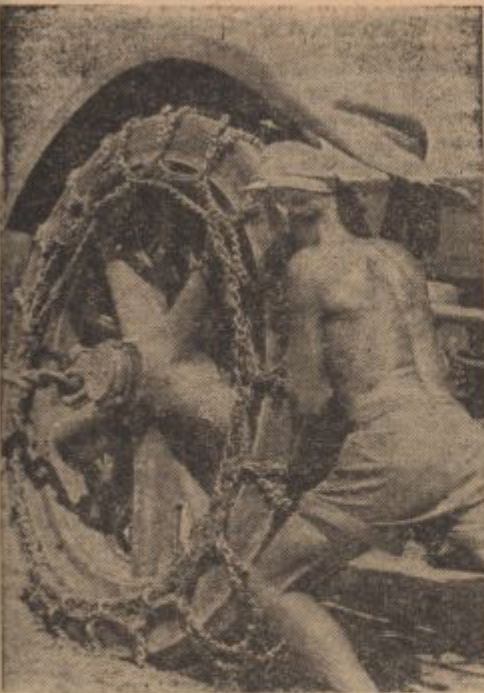
PK-Kriegsbericht Gronefeld (Sch)