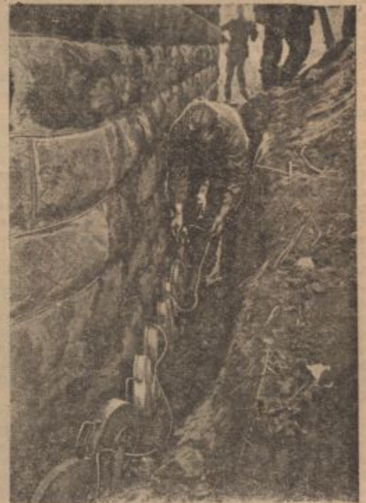
PK-Kriegsbericht Krippans (Sch)

□ Korektno zadržanje nemških vojakov pred Vatikanom. Rimski dopisnik švedskega lista »Stockholms Tidningen« piše, da je treba priznati, da je zadržanje nemških vojakov ob meji Vatikanskega mesta silno korektno. Vse govorice o neklih incidentih so popolnoma izmišljene. Doslej še ni bilo zabeležiti niti enega incidenta med nemško vojaško oblastjo in predstavniki Vatikanskega mesta.