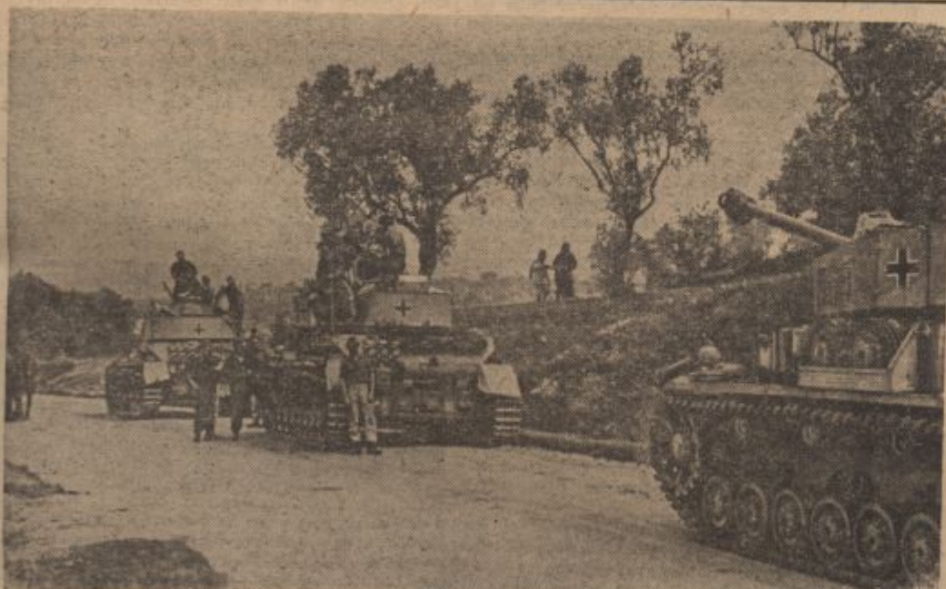
PK-Kriegsbericht Funker (Sch)

ločnost in njena skrajna pripravljenost v pomoči, utrjujejo narodu tudi danes, zlasti v težini zračne vojne hrbenico in mu dajejo moč. Ako si bomo ohranili duha, ki se očituje na bojnih poljih prav tako kakor v domovini, ne moremo te vojne nikdar izgubiti, temveč bo prinesla veliko nemško zmago. Ves nemški narod vé, da gre za biti ali ne biti. Mostovi so za nemškim narodom podrti. Nemškemu narodu preostaja samo še pot naprej. Radi tega mora ostati narod trden in mora vztrajati do dokončne zmage. Naj traja vojna še tako dolgo in naj bo njena teža čestokrat še tolika, mi se bomo povsod borili in ne bomo nikdar omaqali, dokler ne dosežemo svojega cilja. Vzemite v svojih srcih neomajno in trdno vero seboj, da bo ta vojna končala z velenemško zmago, ako se naša volja ne bo zamajala.