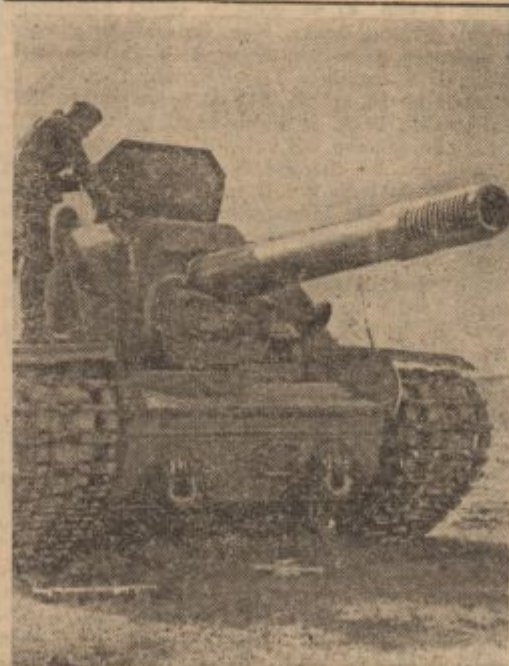
PK-Kriegsbericht Wittke (Sch)

Mlečno in suho dobo pri kravi lahko sami urav-