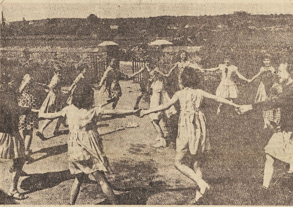
Tudi dnevi šolskega leta bodo kmalu sklenili svoj krog. Kdo bi mogel skriti veselje...?

Občni zbor sindikata delavcev družbenih dejavnosti V torek 10. junija bo v ljubljanski Festivalni dvorani II. redni letni občni zbor Mestnega odbora sindikata delavcev družbenih dejavnosti. Odbor bo dal poročilo o svojem dosedanjem delu in sprejel smernice za bo-organizacije in izvolil delegate za doče, sprejel bo pravila o delu občni zbor Mestnega sindikalnega sveta. Občnemu zboru bodo prisostvovali delegati, ki so jih izvolili na občnih zborih osnovne sindikalne organizacije — okoli 262 delegatov in gostov mesta Ljubljane. (Dalje na 2. strani)