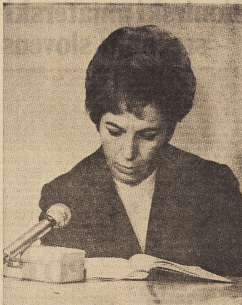
Posnetek iz filma Kazenski zakonik št. 188 . Ideja in realizacija Milan Ljubič, kamera Mile de Gleria, ton Marjan Meglič, montaža Darinka Peršin

Spored vseh filmov pa je označil in pokazal dokaj visoko raven ter izoblikovan estetski filmski čut mladega človeka, ki v marsičem