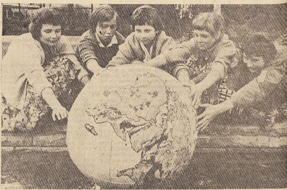
Globus iz plastične snovi, ki ga učenci lahko operejo, potem ko so ga pri pouku geografije prebarvali s suhimi ali vodenimi barvicami