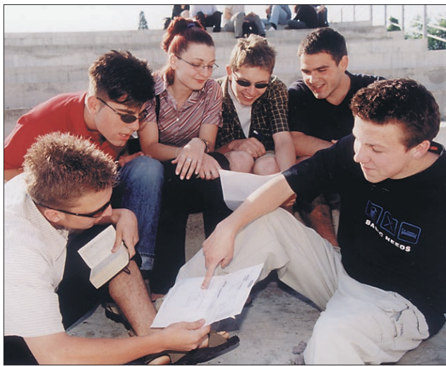
Prvič matura v novi gimnaziji na Ptuj.

Največ maturantov je bilo na Ekonomski srednji šoli, kjer končuje šolanje tudi prva generacija ekonomske gimnazije.