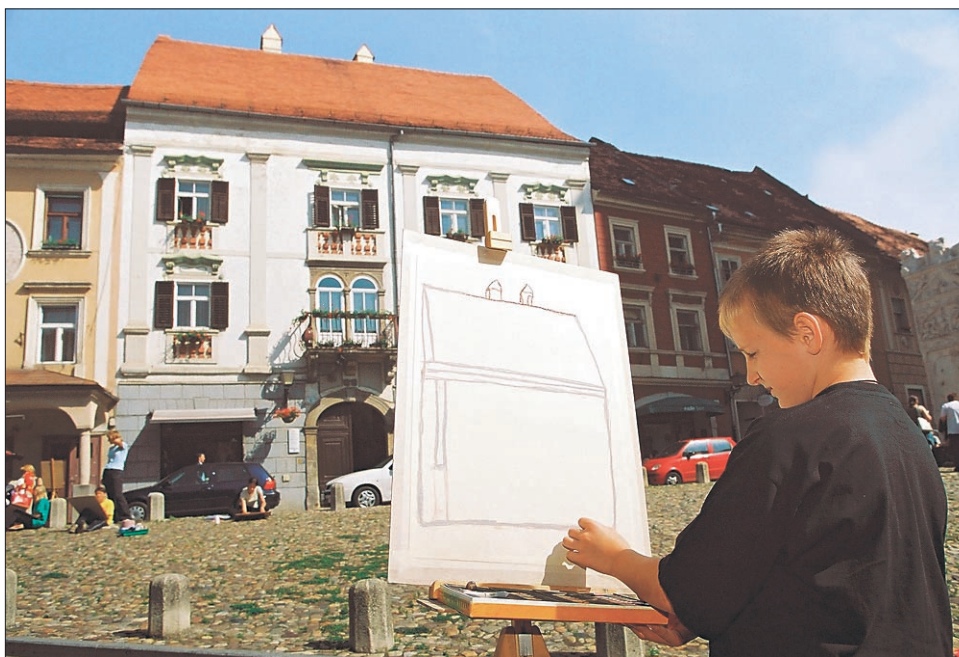
Prejšnji teden je Ptuj gostil mlade likovnike v Mali Groharjevi koloniji.