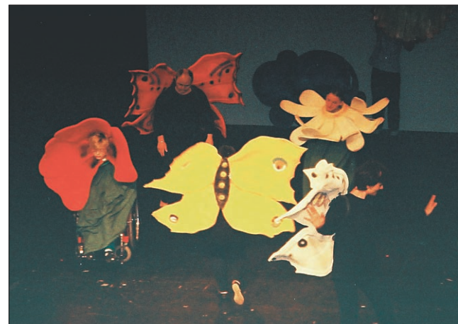
Metulji plesne skupine iz dornavskega zavoda