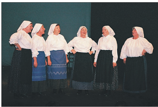
Na večeru folklorne so zapele tudi pevke vokalne skupine Spominčice.

Vrhunec folklornega in plesnega večera pa je nedvomno pomenil nastop odrasle skupi-