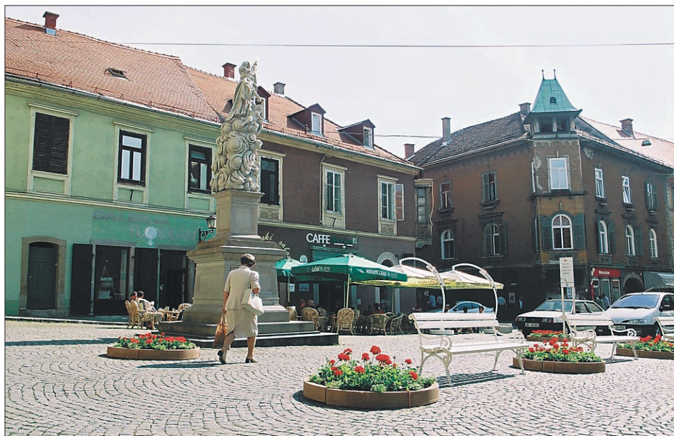
Mestni trg so kot prvega izmed petih ptujskih trgov dodatno ocvetličili.