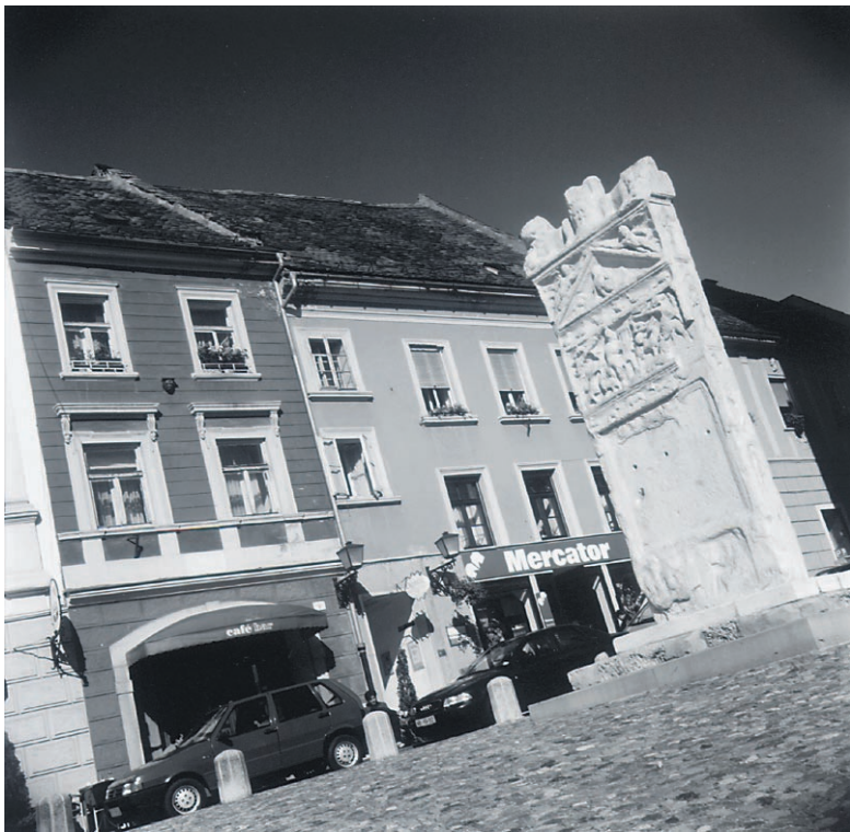
Ptuj bo organizator srečanja prangarskih mest v letu 2003.

V Piranu so 29. maja predstavili zloženko Zgodovinska mesta Slovenije in turistični vodnik Acta Slovenica. V sodelovanju z Združenjem zgodovinskih mest Slovenije je predstavitev organizirala občina Piran. Gre za zanimiva projekta, s katerima želi Združenje zgodovinskih mest izboljšati poznavanje zgodovinskih mest med domačimi in tujimi obiskovalci.