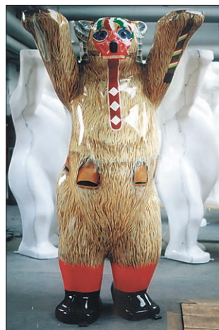
Medved kurent z nekaterimi slovenskimi simboli