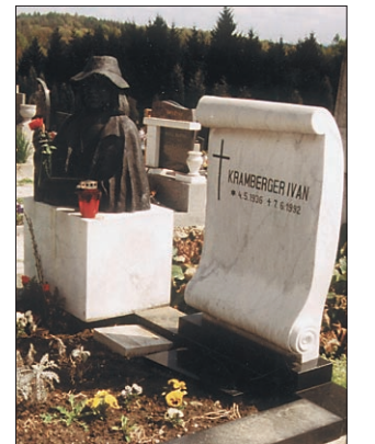
Krambergerjev grob na negovskem pokopališču.

Ob 10. obletnici njegove smrti se ga bodo spomnili tudi pri Negovi. Slovesnost, ki jo organizira krajevna skupnost Negova, bo v nedeljo, 9. junija, pri Negovi. Pričela se bo s slovesno sveto mašo, po maši pa bodo Ivanu Krambergerju odkrili spominsko ploščo. V tamkajšnji osnovni šoli bo na ogled razstava z naslovom Življenjska pot Ivana Krambergerja , ki so jo pripravili učenci 7. in 8. razreda. Slavnostna govornica pa bo