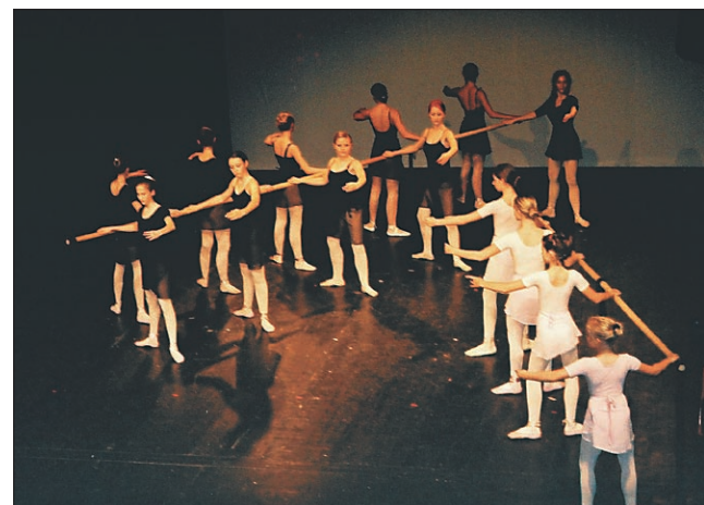
Dekleta baletnega studia so ob drogu prikazale vse baletne prvine.