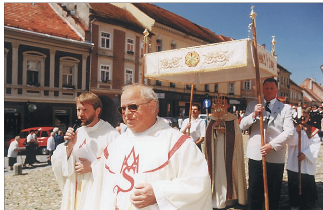
Druga postaja procesije je bila na Slovenskem trgu pred gledališčem.