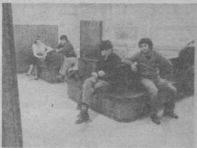
Preurejena čakalnica v zdravstvenem domu Polje.