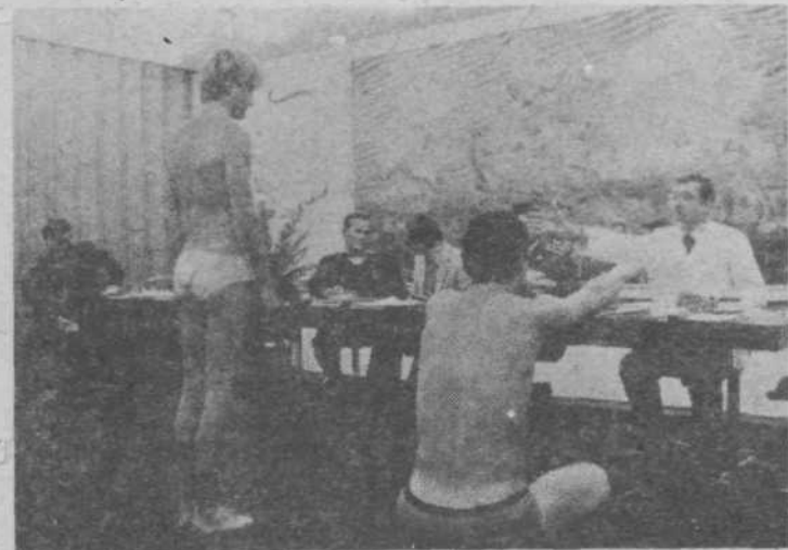
Naborna komisija je svoje delo opravljala v prostorih doma Španski borci.