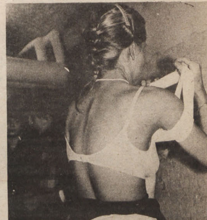
Plakat za »Orgije v šibični škatlji«

Italijansko jugoslovanski barvni pizza western: Kavboj na kobili jaše in se z makaroni baše. Režiser: Ponteroso Prima Igrajo: Rifle Perlira, Mujo Mitmarka in Huso Sadolar Film bo na sporedu cel mesec.