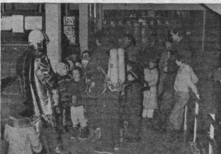
Takole so se nekoč gasilci predstavili v vrtcu cicibanom