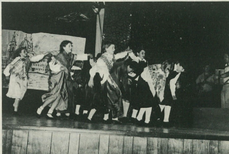
V gledališču »F. Prešeren« v Boljuncu so v soboto proslavljali desetletnico poimenovanja šole po Franu Venturiniju. Na lepo pripravljene prireditvi so nastopali tudi učenci šole na Hrvatinih s katero ta šola že več let sodeluje.