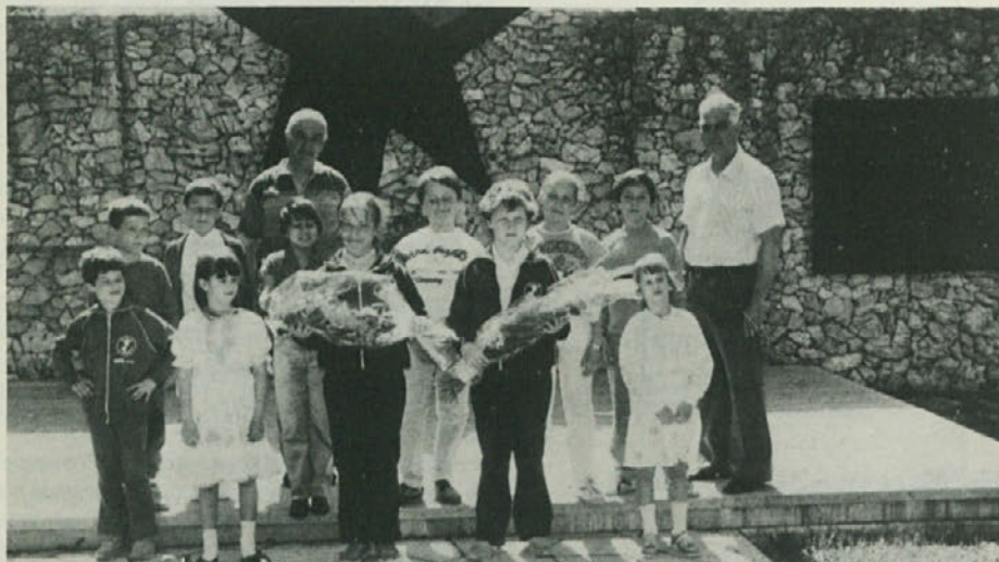
V nedeljo je kriško športno društvo Mladina slavilo deseto obletnico ustanovitve z otvoritvijo novega igrišča, zgrajenega z udarniškim delom. Na sliki najmlajši člani polagajo ob slovesnosti prejeto cvetje pred spomenik padlim v NOB.