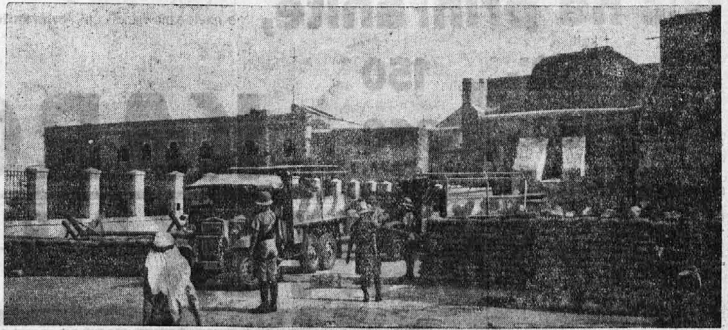
Takole so zavarovali Angleži Bethlehem pred arabskimi vstahi. Obzidja in motorizirani oddelki čuvajo angleško posest in mir v Palestini, v Evropi pa dogovori z Italijo in Nemčijo, ki odkrito simpatizirata z uporniki.

Zatemnitev kraja v noči od 24. na 25. oktobra je bila tako temeljita, kakor da smo zares sredi vojne in zračnih napadov. Ljudje so vajo resno vzeli. Sicer v podeželju