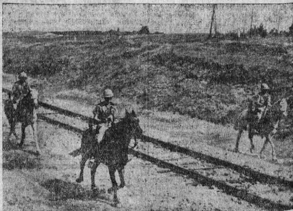
Britanski konjeniški vod straži železnico v Jeruzalemu pred arabskimi vstaji, ki pa imajo kljub svoji maloštevilnosti prednost pred tujimi vojniki, ker dobro poznajo ozemlje, v katerem se dnevno vršijo borbe.

□ V Pragi so imeli velike demonstracije proti Zidom. Nemci so za to Čehi zelo pohvalili.