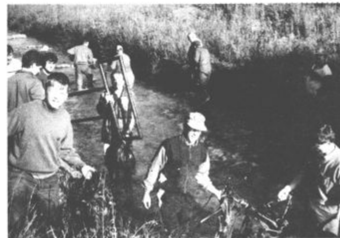
Polne roke "zanimivih" stvar...