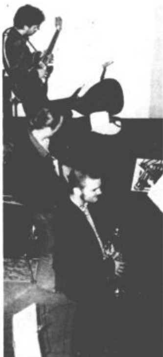
Petkov večer se je po dixi ritmih zazibal še v bolj free jazzovski, z odlično zasedbo skupine Bite the Dust

Nekoč dan mladosti, ki se ga mnogi še sedaj spominjajo z nostalgijo, je v Velenju že pred štirimi leti dobil dober nadomestek. Dan mladih in kulture. Prireditev, ki jo je tudi letos pripravil Šaleški študentski klub, je priložnost, da se predstavijo mladi ustvarjalci iz Velenja in širše okolice, priložnost za ustvarjalno (in "kar tako") dru-