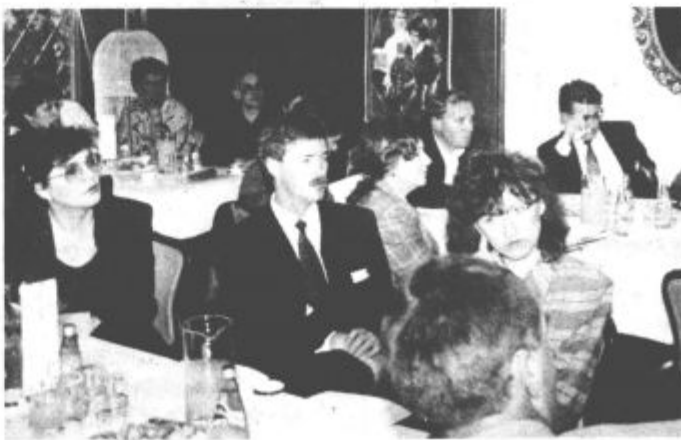
Vloga trgovine, njen položaj, predvsem pa povezovanje in sodobni tokovi v trgovini so bile osrednje teme srečanja z naslovom Združimo znanje za uspešnejši jutri. Udeležilo se ga je približno 60 predstavnikov slovenskih trgovskih hiš. Mifogrede takšnega srečanja ni organiziralo še nobeno slovensko trgovsko podjetje

ske fakultete iz Ljubljane, so udeleženci v razpravi ugotavljali, da so takšna srečanja potrebna.