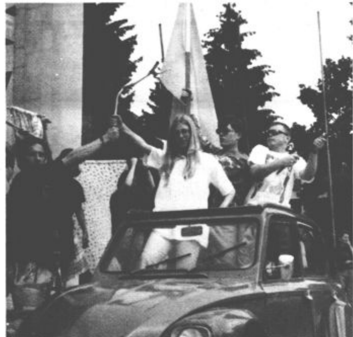
Štafeta norosti med predajo na Titovem trgu...