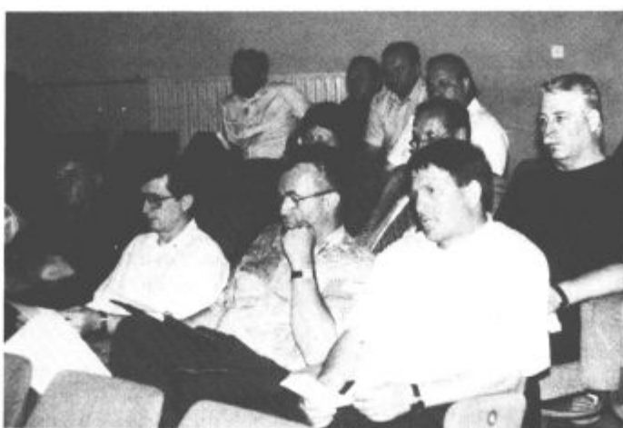
V dvorani se je zbralo dovolj obrtnikov in podjetnikov in ob vseh ostrih je bilo slišati tudi nekaj samokritičnih besed

Problematika zamudnih obrestí je posledica težkega gospodarskega položaja po izgubi trgov in prestrukturiranju domačega gospodarstva, zaradi česar se je veliko podjetij znašlo v stečaju ali zašlo v hude gospodarske težave. Država ni zagotovila finančne discipline, prišlo je do zlorab, splošnega plačilnega nerada in poravnavanja z veliko zamudo, mnogokrat do poravnave sploh ni prišlo. Ob vsem ostalem je bila neučinkovita tudi izterjava obres-