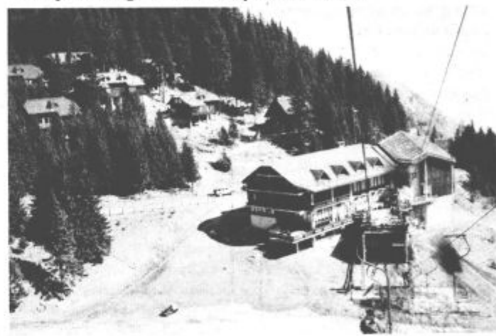
Brez republiških vlaganj se našim smučarskim centrom obetajo vse slabši časi.