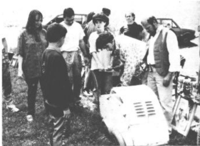
Ponudba na boljšem sejmu je bila prav neverjetna, tale lesen voziček pa skušnjava za mlade študentske pare

Ampak, tu je bil še ves sobotni dan. Ko se je prebudilo študentstvo jutro, so na grad prišli prvi radovedneži in prodajalci