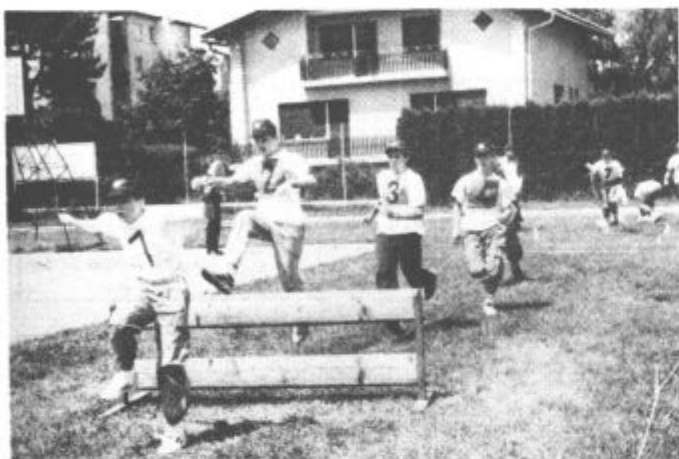
Med nastopom mladinske desetine z Gomilkega