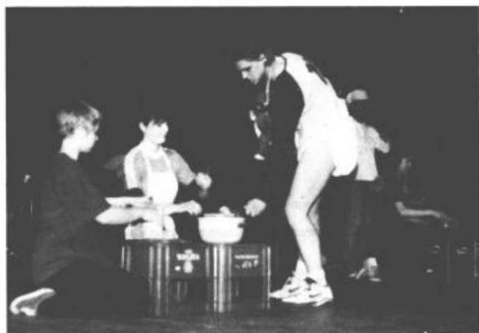
Začetek prireditve: gimnazijska rock opera "Krst TV", v njenem programu pa tudi kuharski nasveti