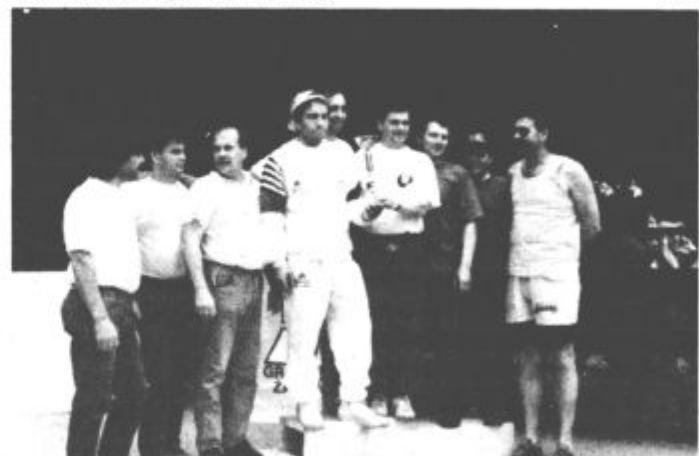
Polzelani na najvišji stopnički.