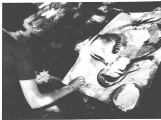
Mali in veliki udeleženci likovne delavnice so se povzpeli na gršč, v senci in miru pa je nastalo kar nekaj zanimivih del (vos)

vsega, kar sodi na boljši sejem. Skorajda je bilo zanimanje slednjih večje, kot zanimanje prvih. Na vrhu hriba so mali in veliki v likovni delavnici ustvarili kar nekaj slik, ki so jih kasneje postavili v grajski atrij. Pri delu jih je premočil le hrup, ki je prihajal iz grl udeležencev Štafete norosti, ki je na pot krenila iz Šaleškega gradu točno ob 12.00, ko so zatulile sirene, se ustavila na Kardeljevi ploščadi, v centru mesta in na Titovem trgu, ob petju in igranju pa se je od tu odpeljala do vznožja gradu in po strmem vzponu končala svoje poslanstvo ob nastajajočem odru, kjer se je zvečer