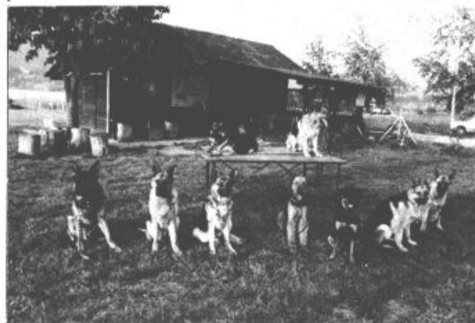
Ja, ko pa že imaš takole izšolanega psa, je lahko vsak lastnik še kako ponosen nanj....

Pesje - Na vadbenem poligonu v Pesjem, kjer ima kinološko društvo tudi svoje prostore, že nekaj mesecev potekajo tečaji za poslušnost, intenzivno pa se pripravljajo tudi za A - izpite rodovniških psov. Kot smo izvedeli, bodo A izpiti v soboto, 18. junija 1994. Med odmorom, ko so se psi po naporni vadbeni uri odležali in za 15 minut dobili povelje sedi, smo naredili tale posnetek. Med tem so si tudi lastniki in vodniki psov oddahnili in se odležali.