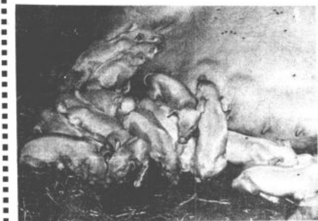
Številni naraščaj ob mami svinji