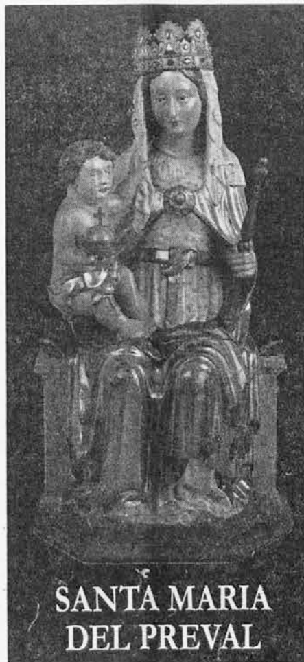
Matil božja s Prevala

»Lahko je biti svetnik, ko nočeš biti človek.« je pravil Marx. V resnici pa po tem nisi ne človek ne svetnik: to je velika laž farizejstva. (Jacques Maritain, Integralni humanizem)