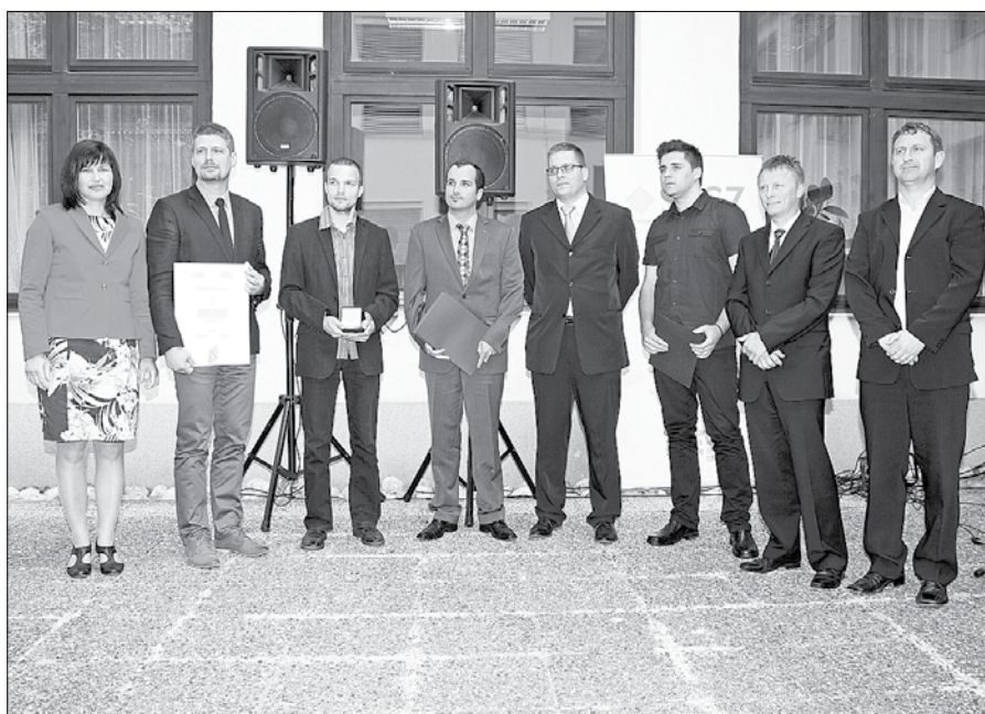
Skupina inovatorjev podjetja BSH je prejela zlato priznanje za izboljšave in novosti aparata Tassimo Suny.