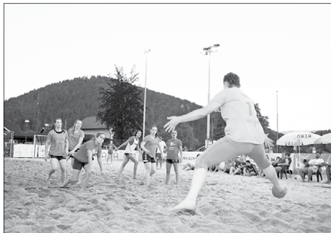
Nazarske rokometiške so si z nastopom v Mozirju izborile pot do morebitnega državnega naslova.

Zavoljo mehke podlage so bile akcije na vroči mozirski mivki še bolj atraktivne kot pri običajnem ro-