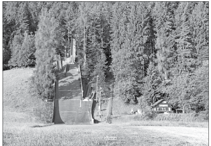
Na Ljubnem želijo urediti športno turistični center ob skakalnici in v Vrbju.

drugim razviti blagovno znamko za les za Solčavsko oziroma SAŠA regijo in vzpostaviti drevesno verigo od lesa do produkta. V projektu, naslovljenem »Mobi hiša – mreža za izdelavo mobilnih lesenih hiš«,