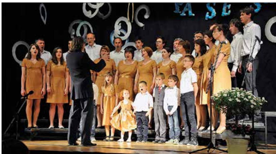
Letošnje srečanje je ponovno združilo preko 200 pevk in pevcev iz celotne doline.

Strokovna sodelavka JSKD na območni izpostavi Mozirje Simona Zadravec je povedala, da je namen tovrstnih revij predstavitev preteklega