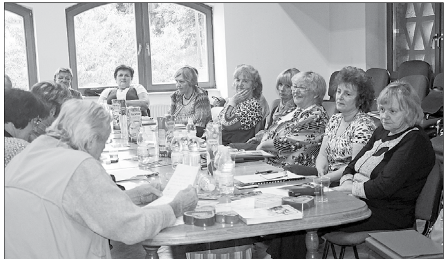
Literati mozirskega in laškega območja so brali svoja literarna dela.