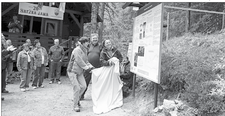
Informativna tabla bo številnim obiskovalcem Snežne jame postregla s potrebnimi informacijami in opisom naravovarstvenega pomena jame.

Slovesnost ob odkritju table sovpada z dogajanjem v letošnji sezoni, ko člani Jamarskega kluba Črni galeb Prebold praznujejo 45-letnico svojega jamarsko raziskovalnega dela in 25-letnico začetka urejanja Snežne jame za turistične namene.