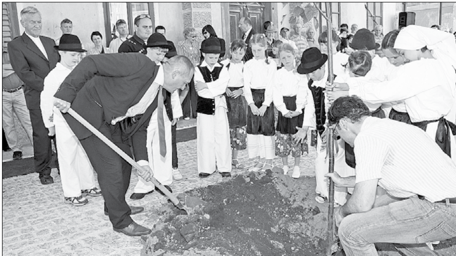
Na slavnostnem dogodku so zasadili mlado lipo na mestu, kjer je prej stala stara Portova lipa.