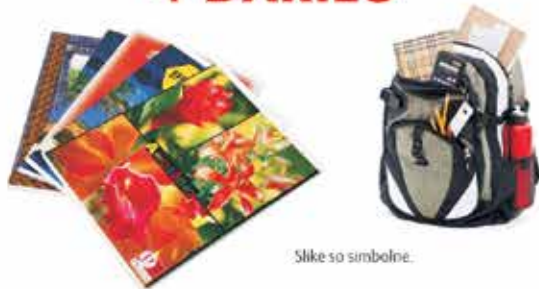
Slike so simbolne.

Ponujamo KAKOVOSTNE šolske potrebščine po UGODNIH cenah + DARILO