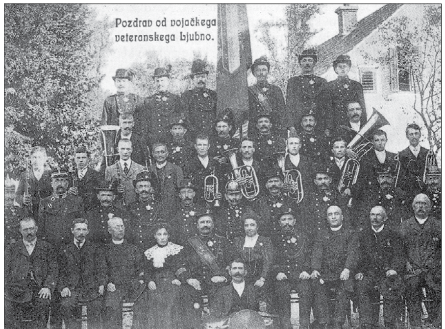
Ljubenski godci leta 1912 med vojaškimi veterani

Dva moška so pokrili z odejo, pod njo sta predstavljala mulo, ki so jo godci privedli v sobo, da bi jo kovač podkoval. Kovač je imel razno orodje, ne ravno kovaško, tudi on je sodil med