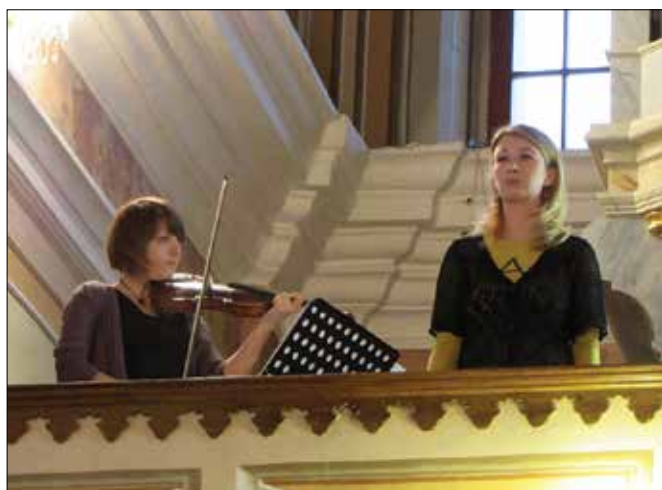
Vsa glasba je prihajala s kora.

kov baroka, ko so orgle doživele enega svojih vrhuncev. Poleg solistične vloge so se uveljavile tudi kot instrument za komorno glas-