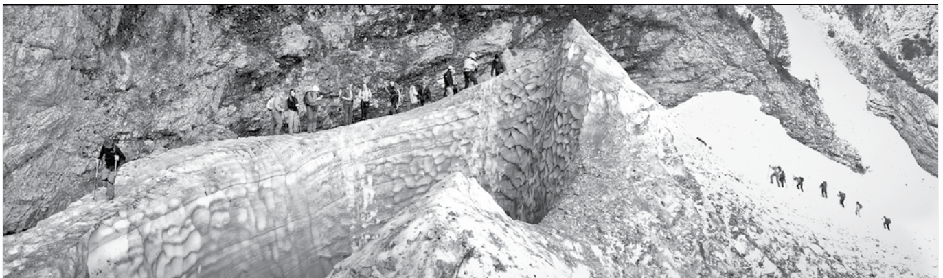
Ker škaf že kar nekaj let ni bil tako globok, je letos privabil še več pohodnikov, planincev in tudi alpinistov, ki so se spuščali vanj.