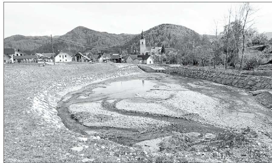
Nivo je uredil okrog 720 metrov struge Trnave od izliva do glavne prodne pregrade tik nad Mozirjem.