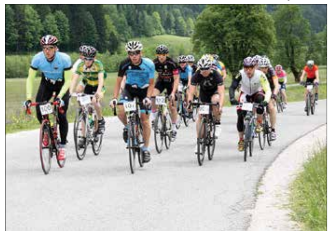
Kolesarji so se na Pavličevo sedlo podali v letečem štartu.