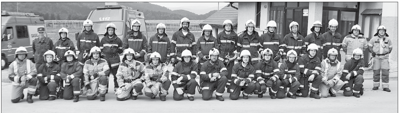
Tečajniki po praktičnem usposabljanju