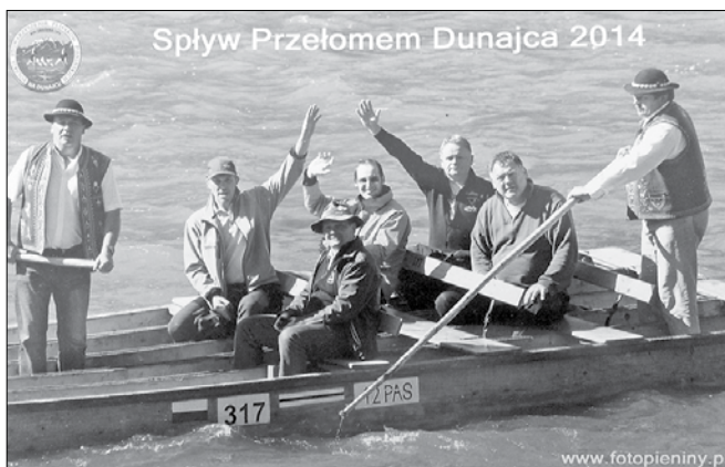
Udeleženci mednarodnega flosarskega festivala v Latviji z Ljubnega ob Savinji so se ustavili pri poljskih flosarjih.

Kot je povedal Lihteneger, se je skupina na potovanje podala z avtodromom, saj je bilo do cilja potrebno prepotovati kar 2.000 kilometrov. Ustavili so se pri poljskih flosarjih, ki so jih gostoljubno sprejeli in jih popeljali na spust s spla-