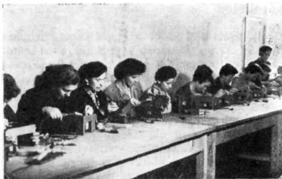
Delitev dela v podjetju EL-RA.

vodski podatki ne povedo mnogo, ker nam dajejo lažno sliko stanja delovnih sredstev. Tretjič. V normalnih pogojih bi se iz amortizacijskih skladov za nadomestitev morala izvršiti (s stališča produktivnosti delovnega sredstva) vsaj enakovredna nadomestitev. Pred vojno je bila večina proizvodnih podjetij v privatni lasti in vprašanje zamenjave delovnih sredstev stvar lastnika, ki pa je imel pred