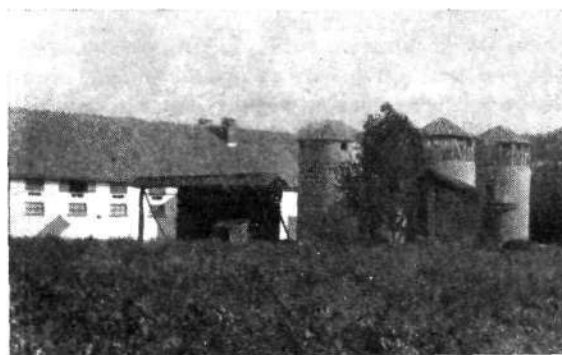
Novo zgrajeni hlev in silosi Kmetijskega posestva na Suhi.

Na tretjem mestu je socialistični sektor obrti, kamor je bilo investiranih 21.441.000 din. Obrt predstavlja tisti sektor gospodarstva, kjer je investicija občinskega ljudskega odbora lahko najučinkovitejša in kjer za večji razvoj niso potrebna nedosegljiva sredstva. Glavni vir finansiranja je predstavljal občinski investicijski sklad. Ker si pod obrtjo običajno predstavljamo podjetja, ki se bavijo z uslugami prebivalstvu (in na tem je prebivalstvo najbolj zainteresirano), lahko rečemo, da je bil v tako uslužnostno obrt investiran le manjši del zneska celotne obrti. Nekaterih obrti namreč ne moremo prištevati med uslužnostna obrtna podjetja, če je njihov način proizvodnje industrijski in delajo za trg. Med taka obrtna podjetja lahko štejemo Pilarno Reteče in »ELRO«, ki bosta slej ko prej prerasli v industrijo. V posamezna obrtna podjetja so bili investirani naslednji zneski: »ELRA« 5.867.000 din, Mesarija OZZ 5.472.000 din, Pilarna Reteče 5.837.000 din, Vrtnarija 2.291.000 din itd.