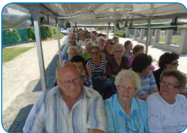
Z malim cugom prauti Fertörákosi

Na konci se želim zavali-ti predsedstvi za pomauč, vsejm izletnikom, ka so se