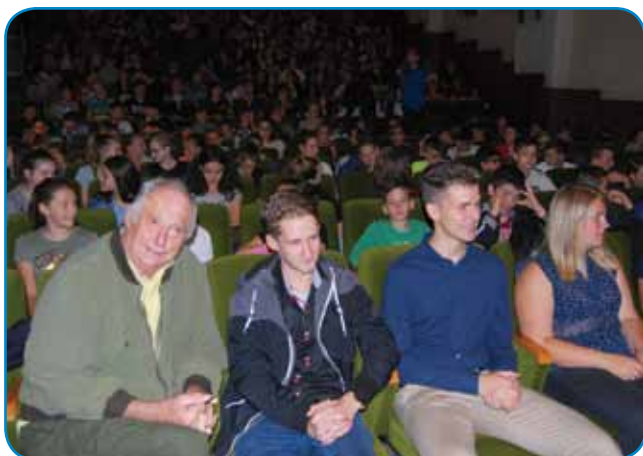
Gledališko dvorano v Monoštru so napolnili dijaki gimnazije