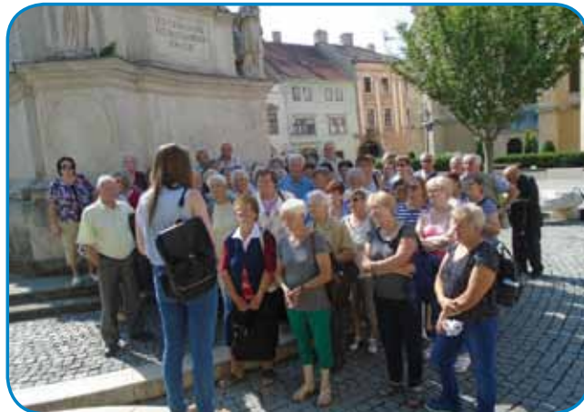
Pred spomenikom sv. Trojstva v Soproni, na pravo je „Kecskés” cerkev

No, za den smo si vöodabrali torek, 5. juniuš, gda eške drži šaulsko leto pa babicam nej trbej skrb meti vnuke pa eške ne more biti nevarna velka