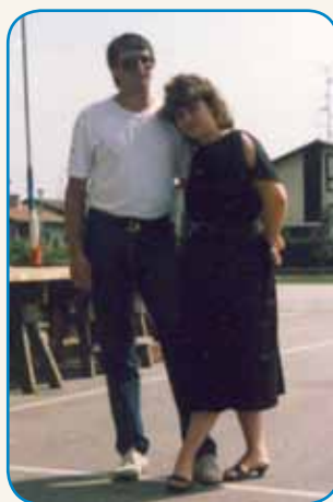
CUG JE BIU NAGEU stran 6