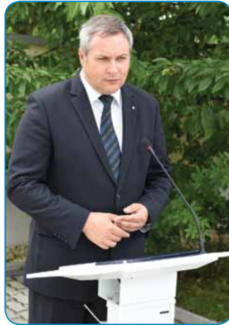
Mag. Dejan Židan, podpredsednik vlade, ki opravlja tekoče posle, na proslavi v Monoštru