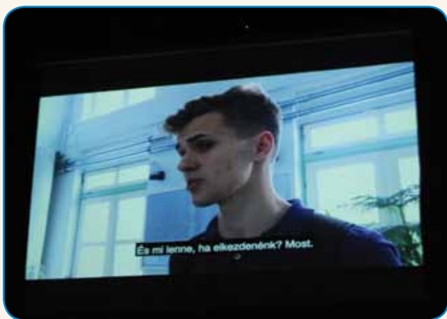
»DA BI MLADI ŽIVELI V SVOBODNI EVROPI« stran 3