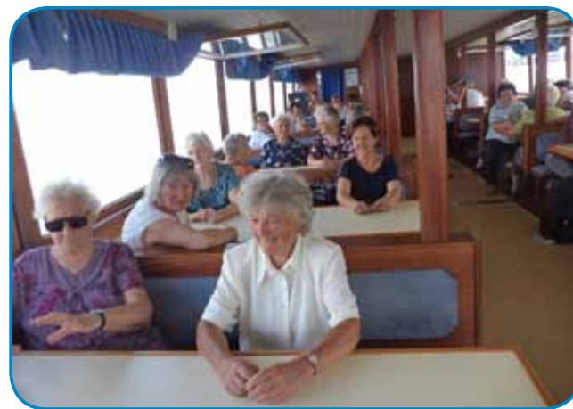
Nisterni so se skrili pred suncom v kabin na šihti, drügi so pa ranč tau uživali vrker na terasi

No, v Varaša zazranka pred šesto vörov smo vsi pri cajti lepau vküper prišli na pano-fi pa smo se v za nas rezervirani vagonaj lepau dola skvatejrali. V taši čisti pa lejpi vagonaj se je veseldje voziti, leko se vövtegneš, odiš, velko mesto je, kulturno leko zejš