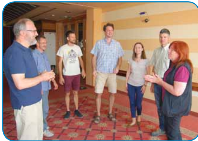
Raziskovalci iz Slovenije in Madžarske so sestankovali v Murski Soboti

S tem je povezano tudi drugo raziskovalno področje, etnografska analiza kultur-