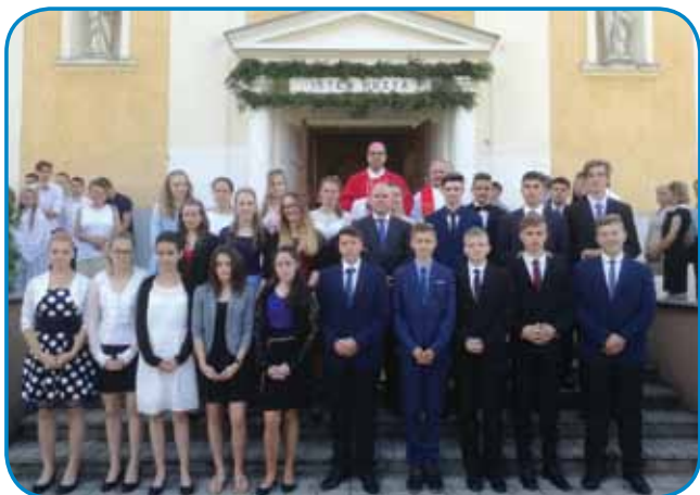
Birmanci s škofom in domačim župnikom pred gornjeseniško cerkvijo

Po izpovedi vere je potrditev v veri prejelo kot darilo svetega Duha 24 mladih Porabcev in Porabk, ki jih je škof mazilil s sveto krizmo. Mašo so zaključili s skupnim petjem vatikanske himne.