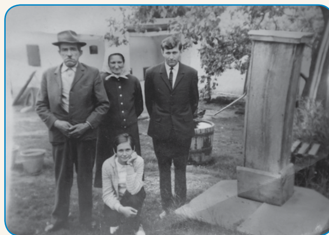
TE SEM ŠE BEJO KAK LADJEN stran 8