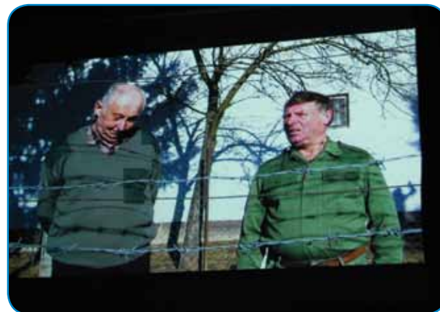
Prizor iz filma: prikaz nekdanje železne zaveses v graničarskem muzeju v Števanovcih