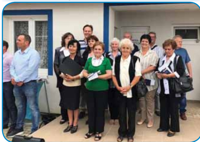
Člani cerkvenega pevskega zbora ZSM iz Števanovec, ki je sodeloval pri maši