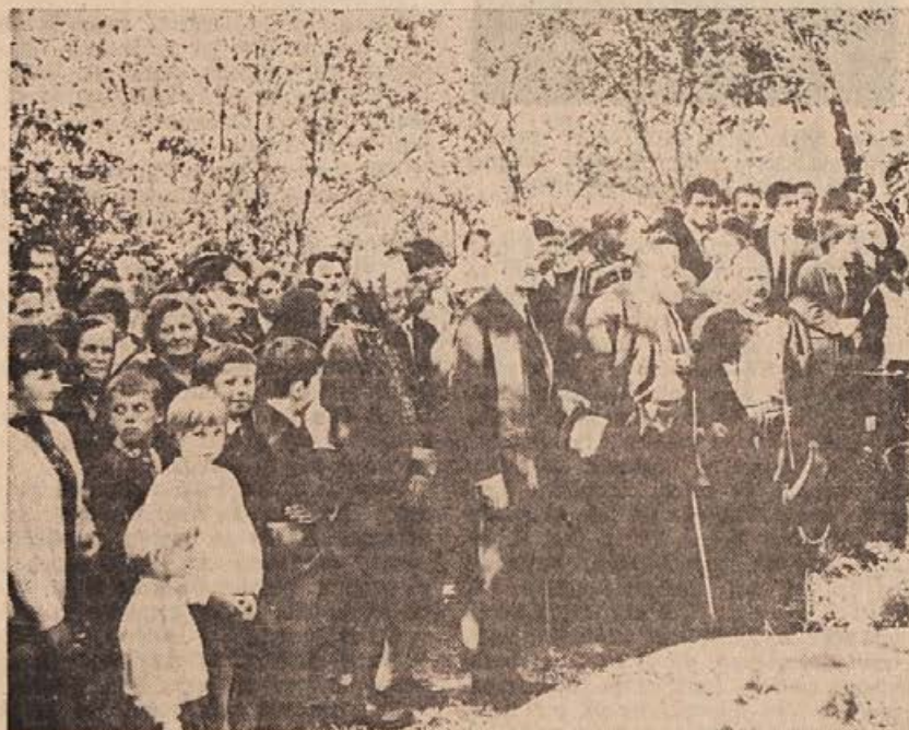
Pogled na del gostov in domačinov, ki so se udeležili odkritja spominske plošče na skladateljevi rojstni hiši. Desno spredaj sta akademski slikar Božidar Jakac in pisatelj Ivan Potrč