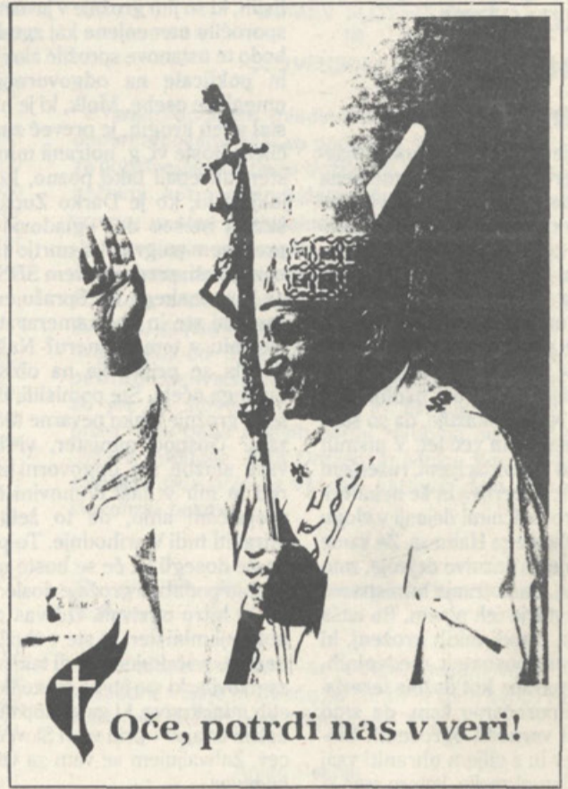
Oče, potrdi nas v veri!

Verski list DRUŽINA je pripravila posebno prilogo za papežev obisk, z naslovom PAPEŽ MED NAMI. Priloga objavlja spored za vse tri dni, ko se bo papež Janez Pavel drugi mudil v Sloveniji 17. maja do 19. maja, ko