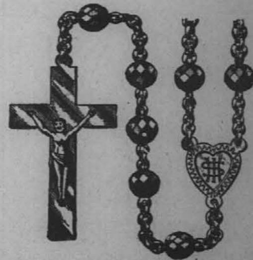
Rožni venci z zlatim križcem stanejo po $1.00.