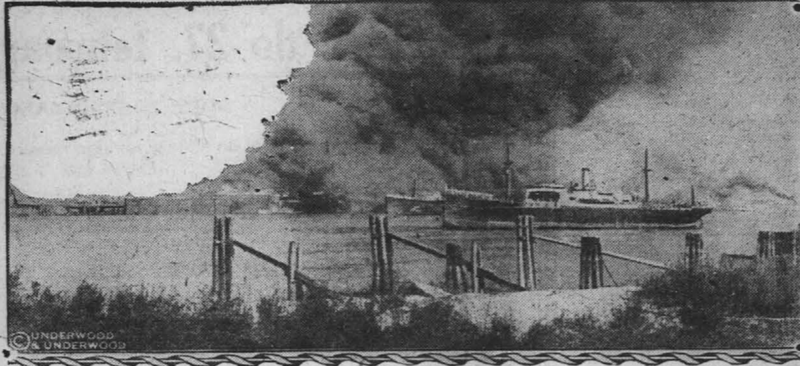
Prizor gorečega parnika v pristanišču New London, Conn.